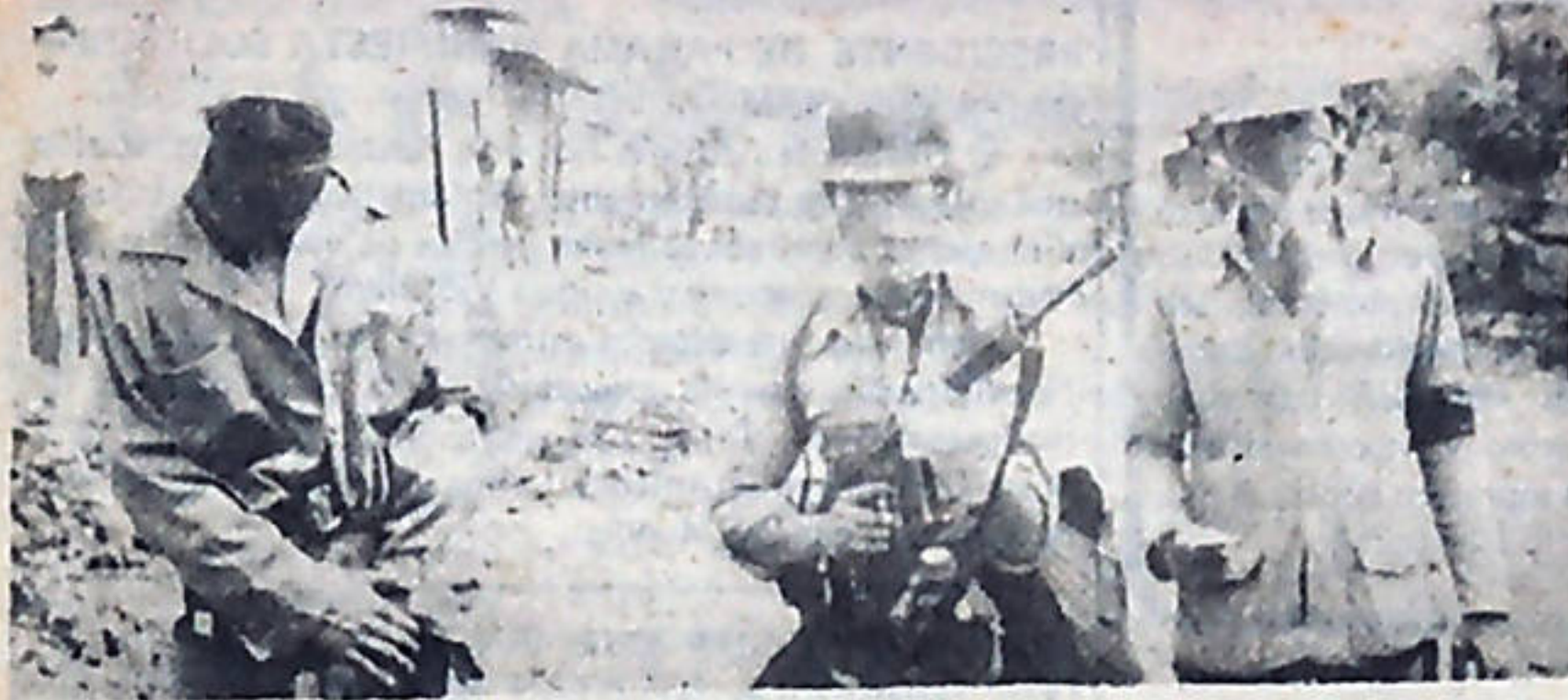
Guerrilleros sandinistas listos para el combate, contra las fuerzas somocistas.