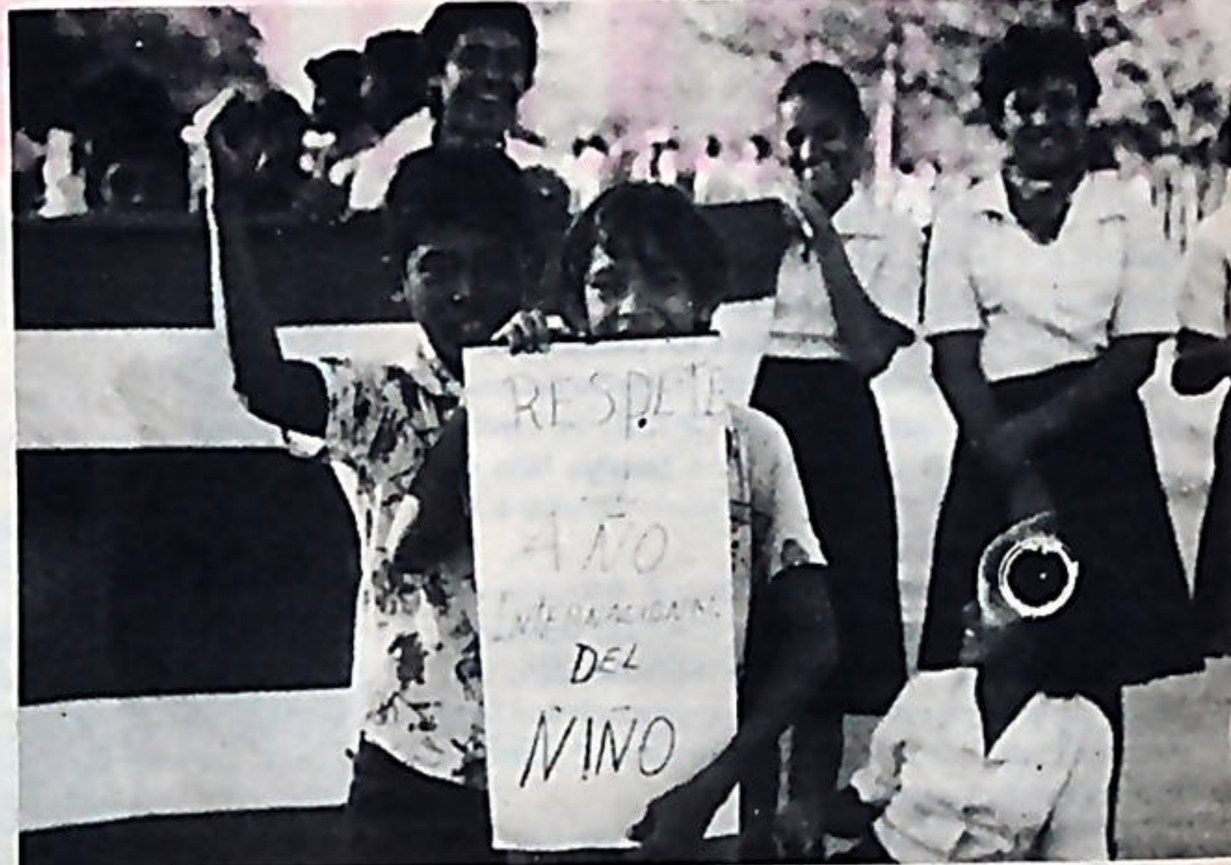
Por un mejor futuro para los niños, también se lucha.