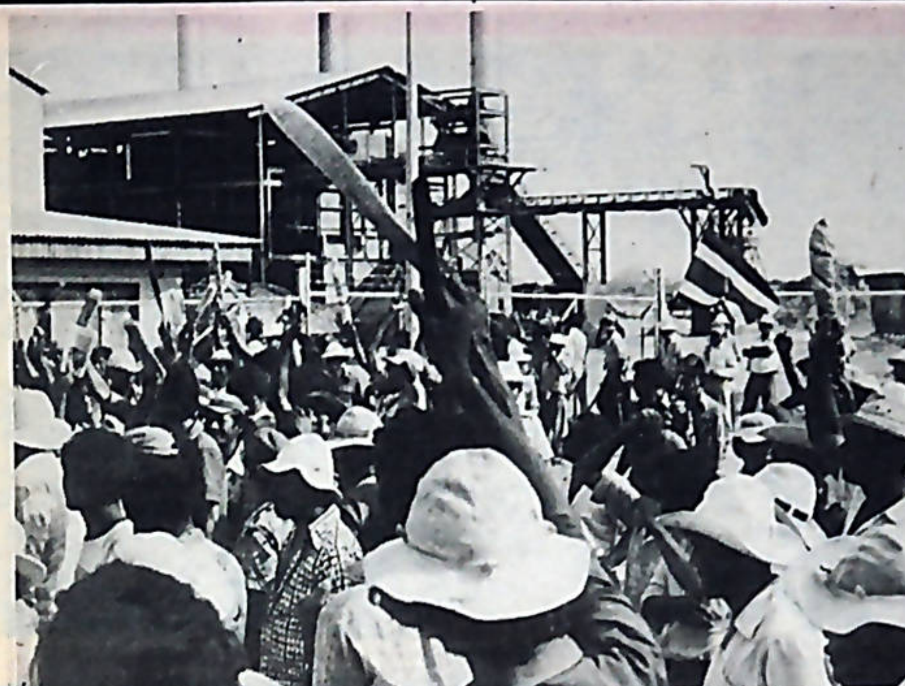
La lucha de los cañeros del Tempisque, es un ejemplo de firmeza y combatividad para el movimiento obrero y popular.

COMISION POLITICA Movimiento Revolucionario del Pueblo (MRP) Partido de los Trabajadores