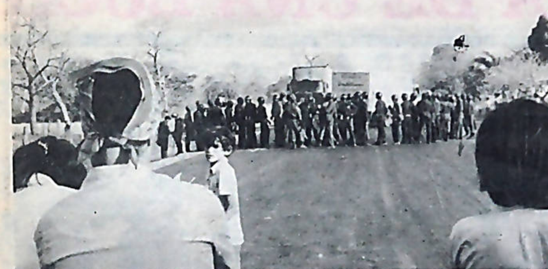
Enfrentando al ejército de la empresa ha estado en todo momento, el ejército de los trabajadores, los estudiantes.

miento de huelga, informando de un arreglo directo entre la empresa y un pequeño grupo que laboraba en el ingenio. Pero esta maniobra también fracasó.