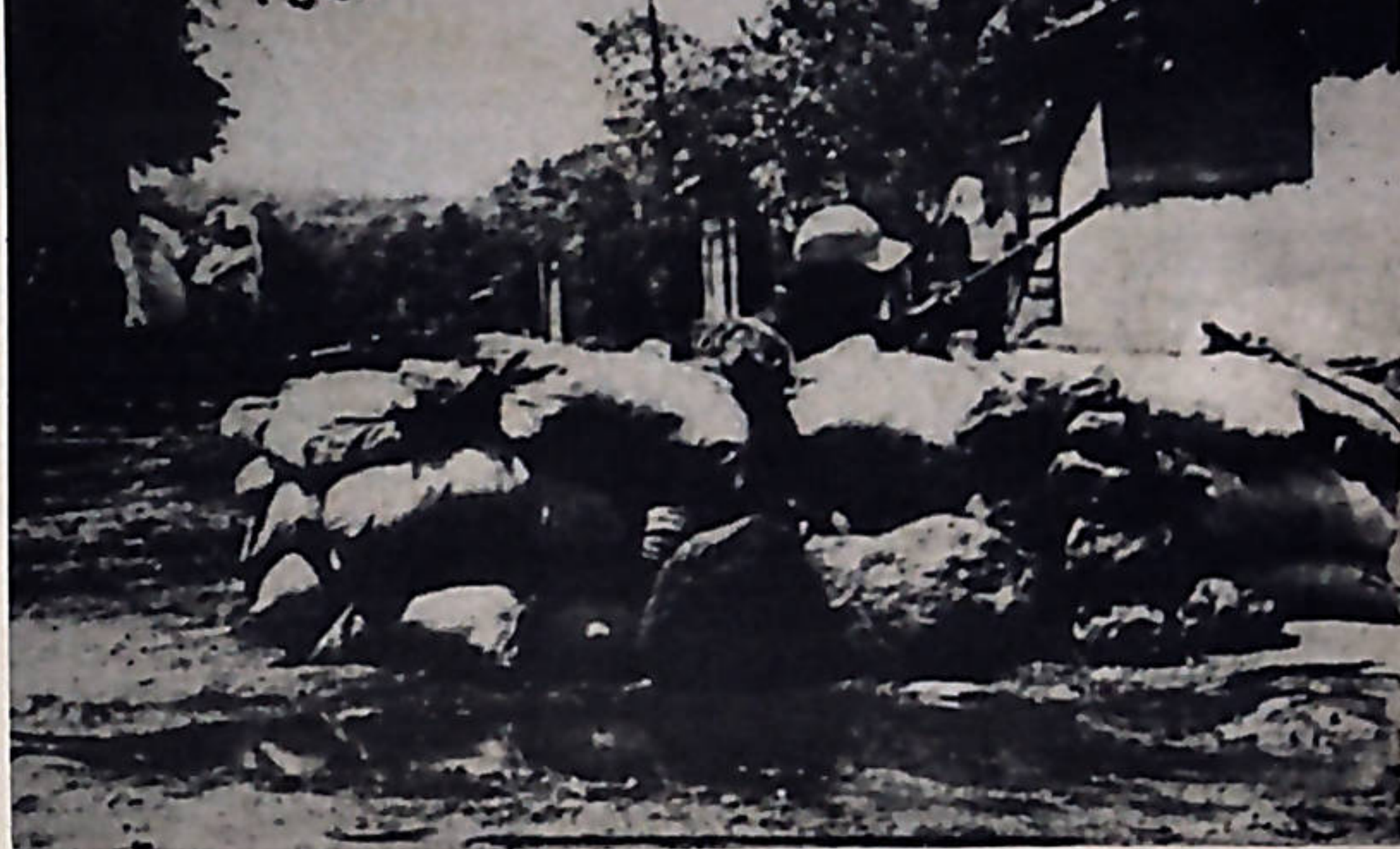
La lucha armada es el único camino que tiene el pueblo nicaraguense para liberarse, afirma el F.S.L.N.

Más tarde los señores del FAO ante la propuesta de ir a un plebiscito estando intactas las bases del somocismo, di-