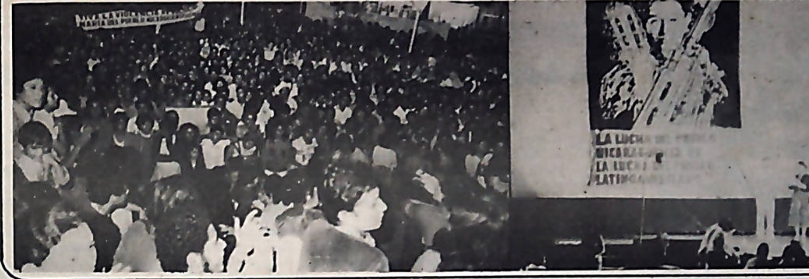
Diversas actividades se han celebrado en los últimos días, de solidaridad con Nicaragua. El juicio a Somoza y la Maratónica de Solidaridad han tenido una enorme repercusión. Las gráficas muestran aspectos de las dos actividades.