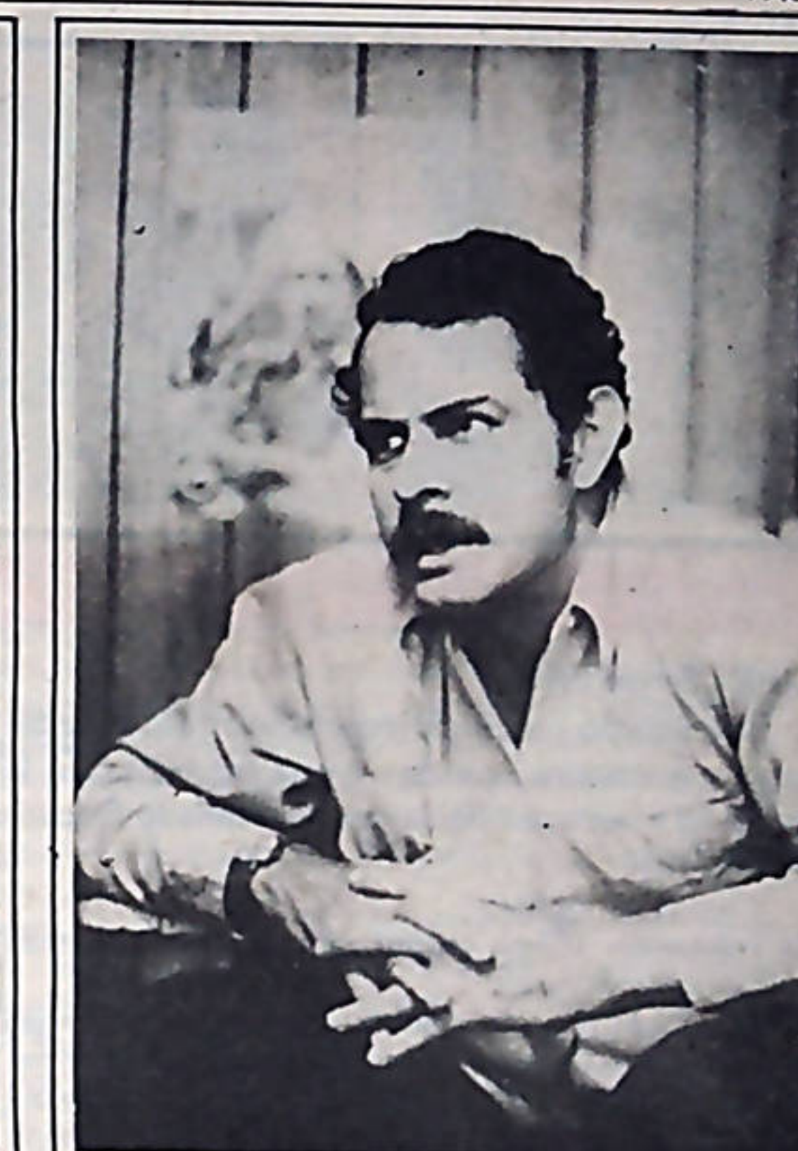
"La perspectiva nuestra está en esos pasos a dar, en términos de agrupar a los sindicatos, más unitarios, que ayuden a avanzar nuestra línea de unidad sindical, de unidad de combativos que nosotros hemos ido ayudando a desarrollarse, en organizaciones más fuertes."