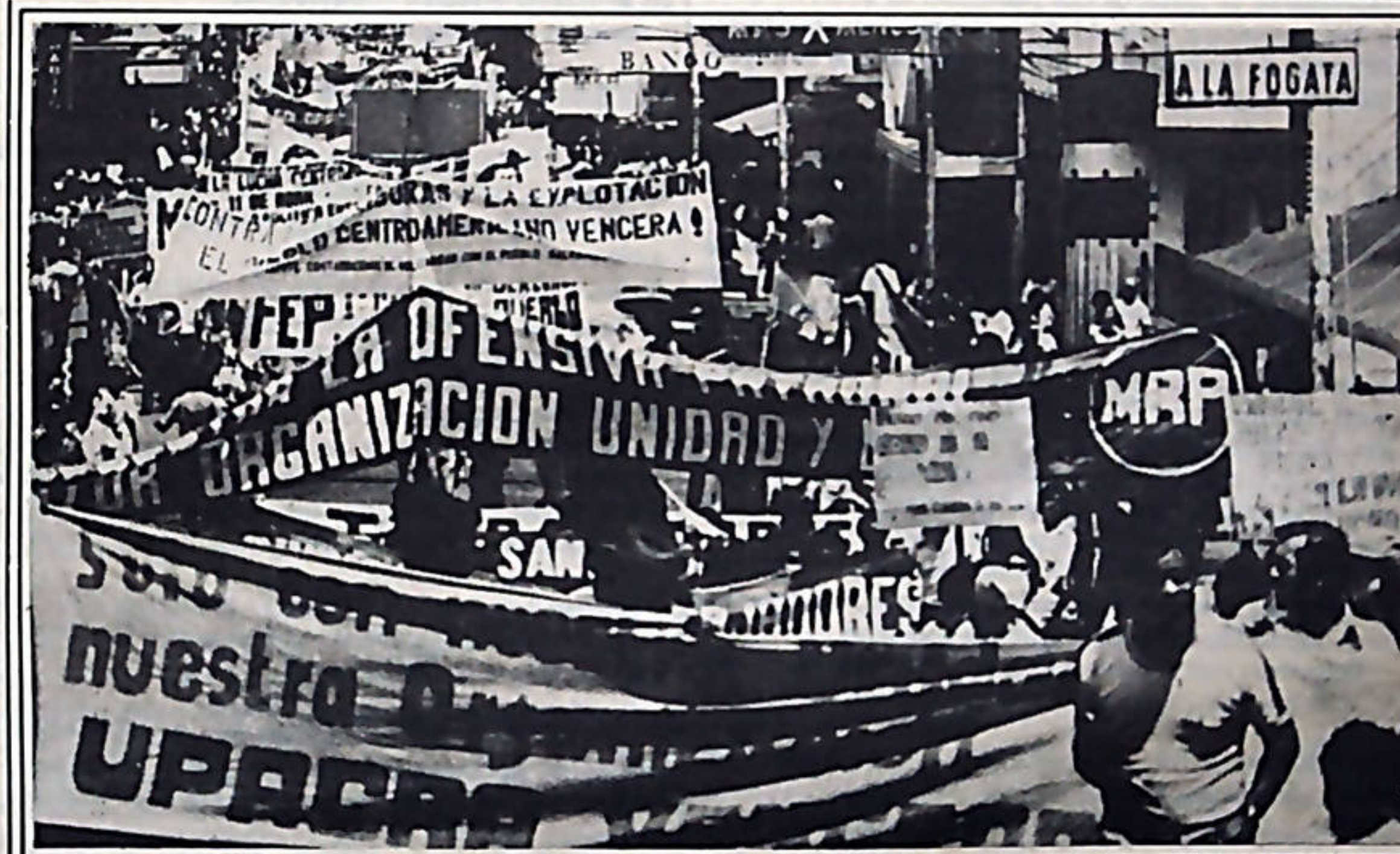
"Los trabajadores están dando respuesta al encarecimiento del costo de la vida y a las serias dificultades que atraviesan, con mayor organización, con mayor lucha."