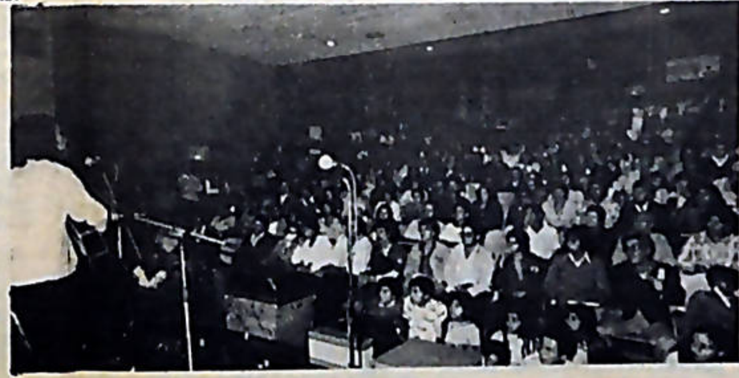
La juventud solidaria con el pueblo nicaraguense se dio cita en Guadalupe.

Todos ellos coincidieron en la importancia de esta actividad que reúne a los jóvenes de toda el área, en un momento en que el imperialismo y las dictaduras militares arremeten contra el movimiento popular, y en que las juventudes, unidas solidariamente luchan por la libertad, el bienestar social y por la segunda y definitiva independencia.