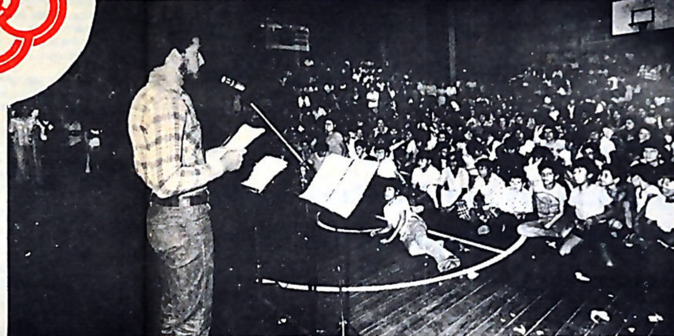
Un aspecto de la inauguración, realizada en el Gimnasio de Alajuela.