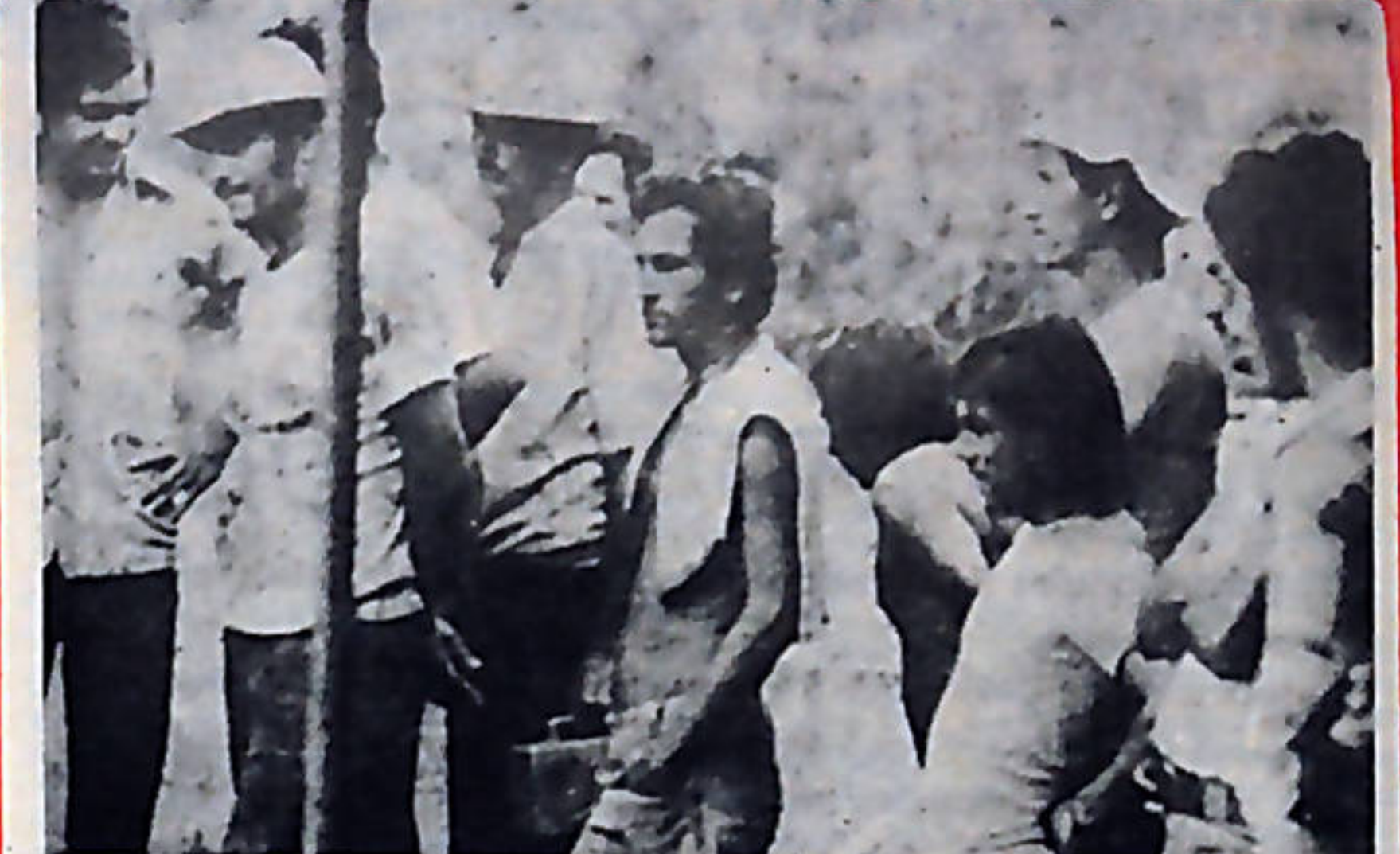
La intransigencia de la patronal y las presiones del Gobierno no han logrado doblegar a los trabajadores bananeros en huelga.

Las actividades, realizadas en honor al encuentro de la juventud en Cuba, fueron aplaudidas con gran entusiasmo por los asistentes a ellas.