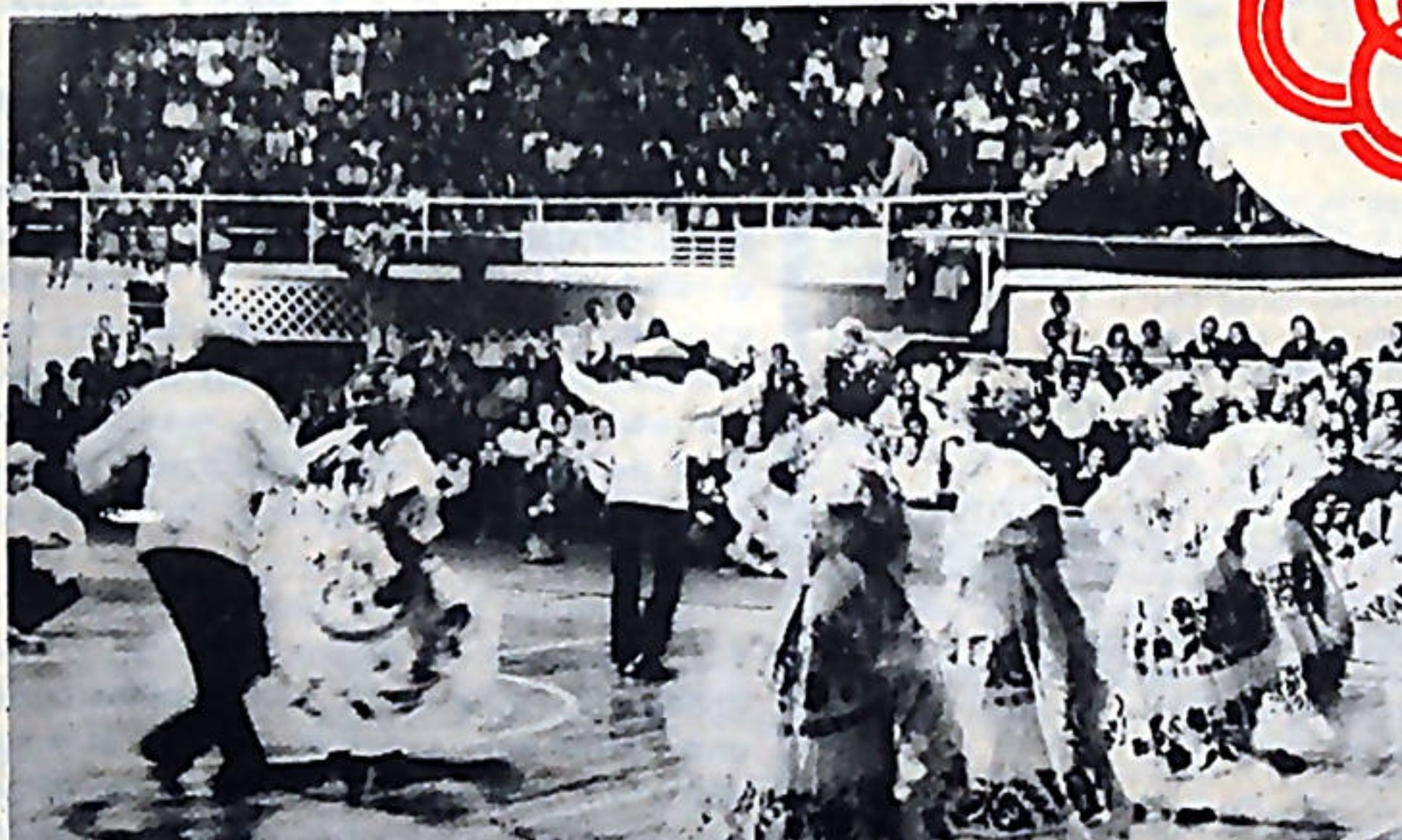
Las delegaciones centroamericanas trajeron en su música, poesía y bailes, el mensaje de los pueblos de toda el área. Panamá y Honduras presentes.