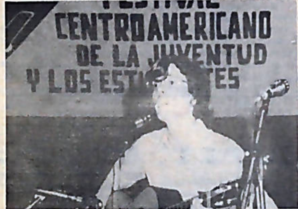
Cuba también envió su representante al Festival.

¡CUBA, CUBA, CUBA, Centroamérica te saluda! fue el grito de alrededor de dos mil jóvenes concentrados en el acto de clausura del Festival. Para despedir el Festival