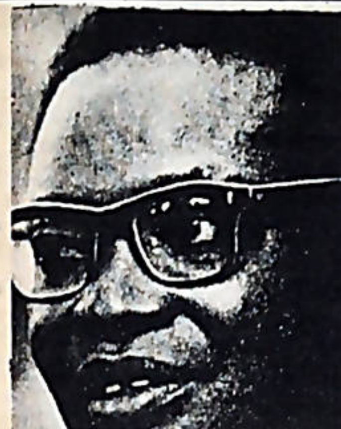
AGOSTINO NETO, MAXIMO DIRIGENTE DEL M.P.L.A.

amplio. Es del interés de todos los revolucionarios de la tierra, la consolidación de Angola como estado revolucionario, la ayuda fraternal y solidaria que el pueblo angoleño, y su vanguardia político-militar, el Movimiento para la Liberación de Angola, reciban, adquiere un carácter vital para este objetivo.