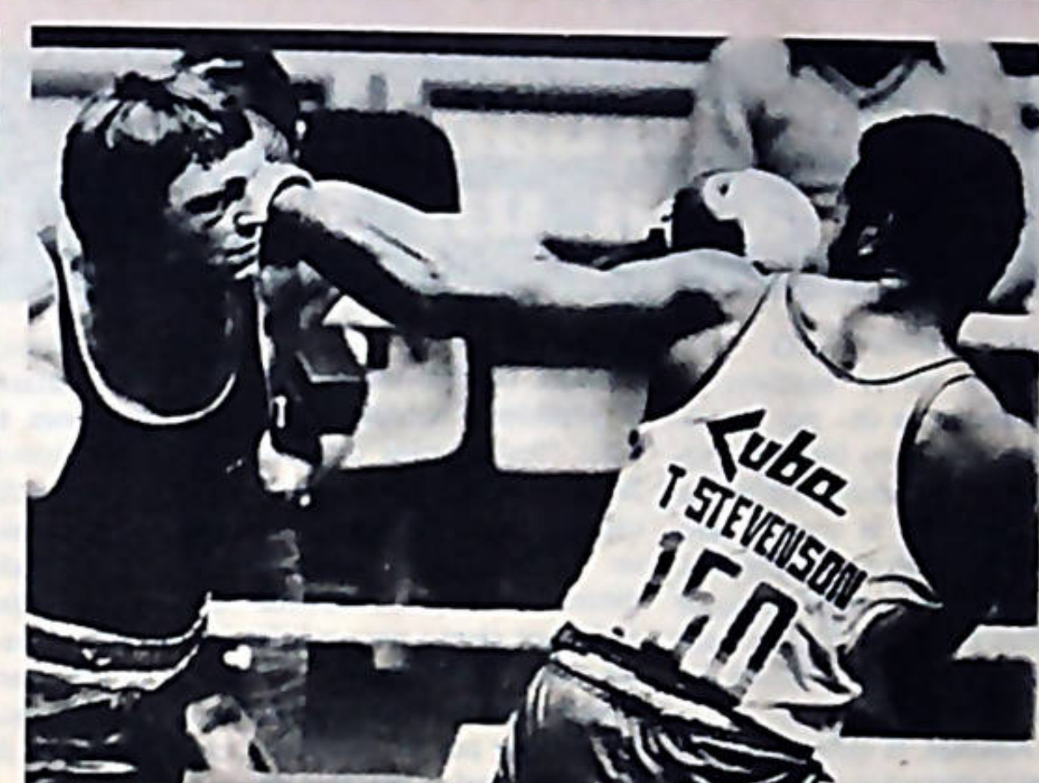
El gigante cubano golpea fuertemente al yugoslavo Dragomir Vujkovic, antes de conquistar por segunda vez el título mundial de la división completa.

La carrera pugilística de Stevenson comenzó cuando residía en el central azucare-