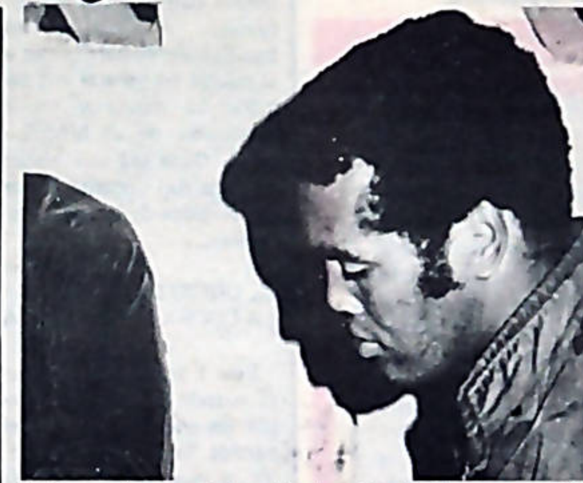
El bicampeón mundial y olímpico de todos los pesos, Teófilo Stevenson. También se supera en los estudios.

"Mi máxima ambición para el próximo ciclo deportivo es participar en los Juegos Olímpicos de Moscú, en 1980", declaró a Prensa Latina el doble campeón mundial y olímpico de todos los pesos, Teófilo Stevenson. "Después de conquistar por segunda vez el título mundial de boxeo amateur en el pasado Campeonato del Orbe disputado en Bengrado, ahora aspiro a obtener por tercera vez la corona olímpica de los pesos completos", agregó el gigante cubano.