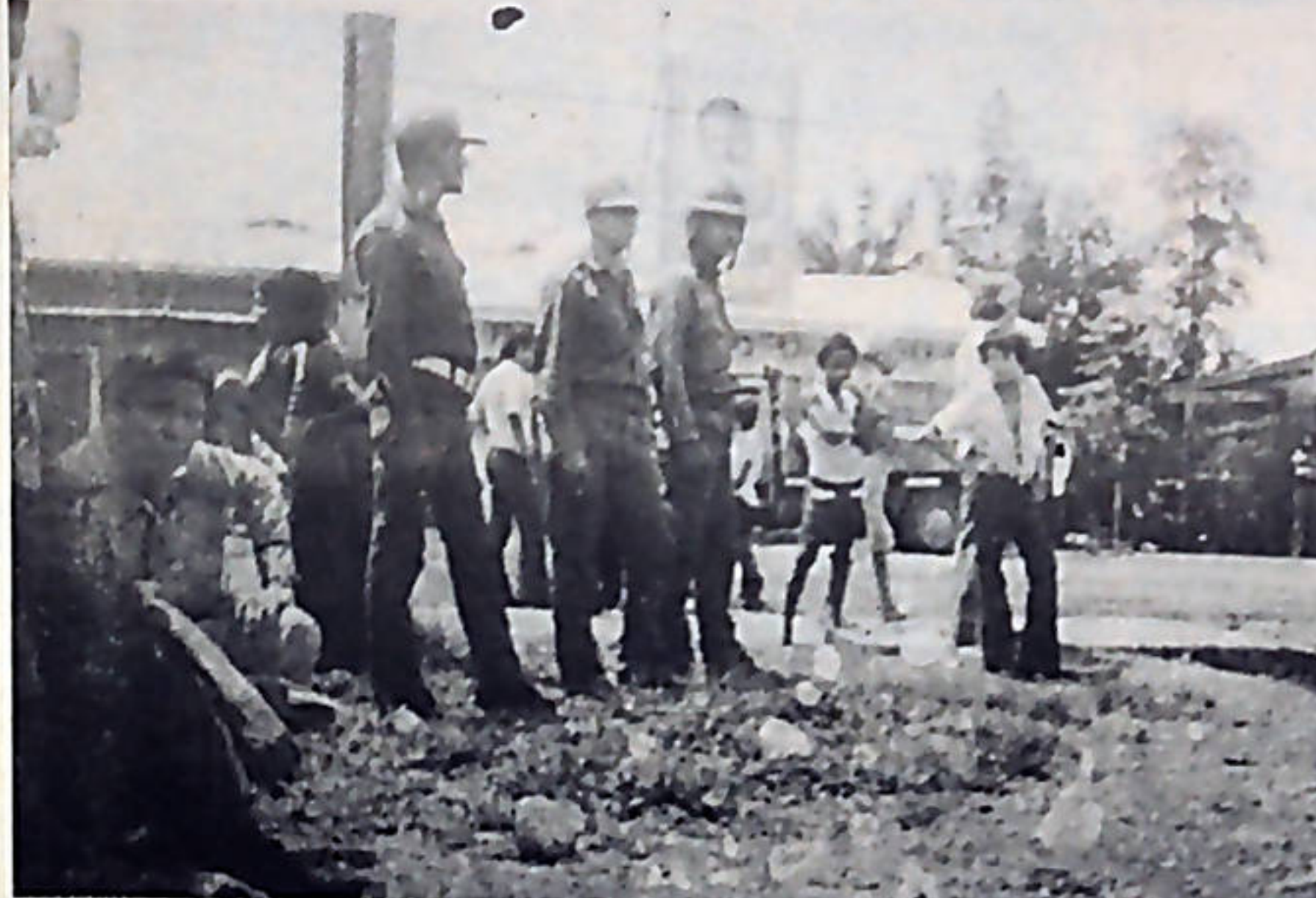
Con el cuento de "mantener el orden", llegaron más de cien guardias enviados por el gobierno. En "Carari" apalearon mujeres, niños y hombres y pisotearon la bandera nacional.