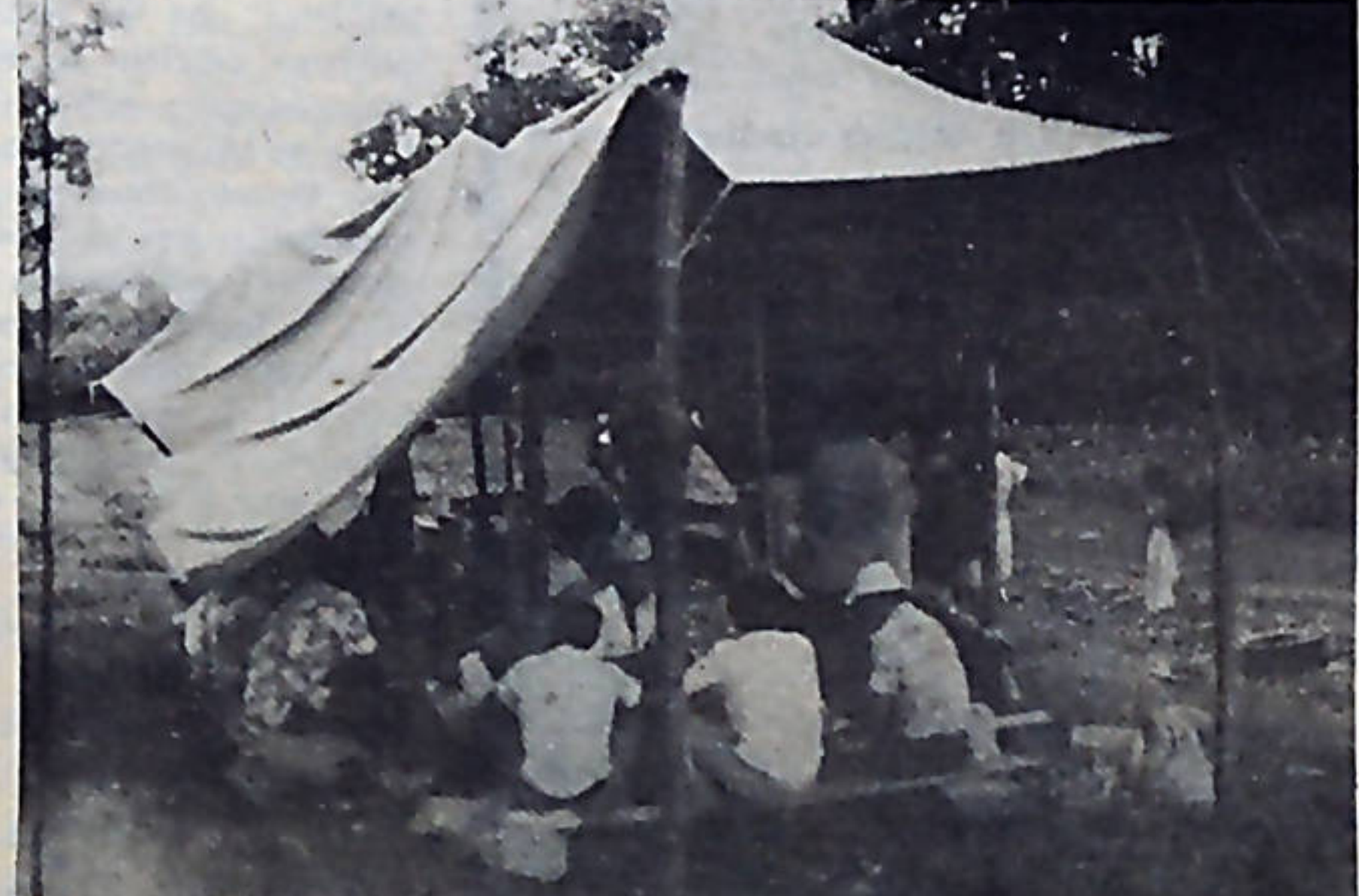
Campamento "Federico Picado". Otro de los puntos de vigilancia donde se impidió con firmeza que pasara maíz para la secadora.