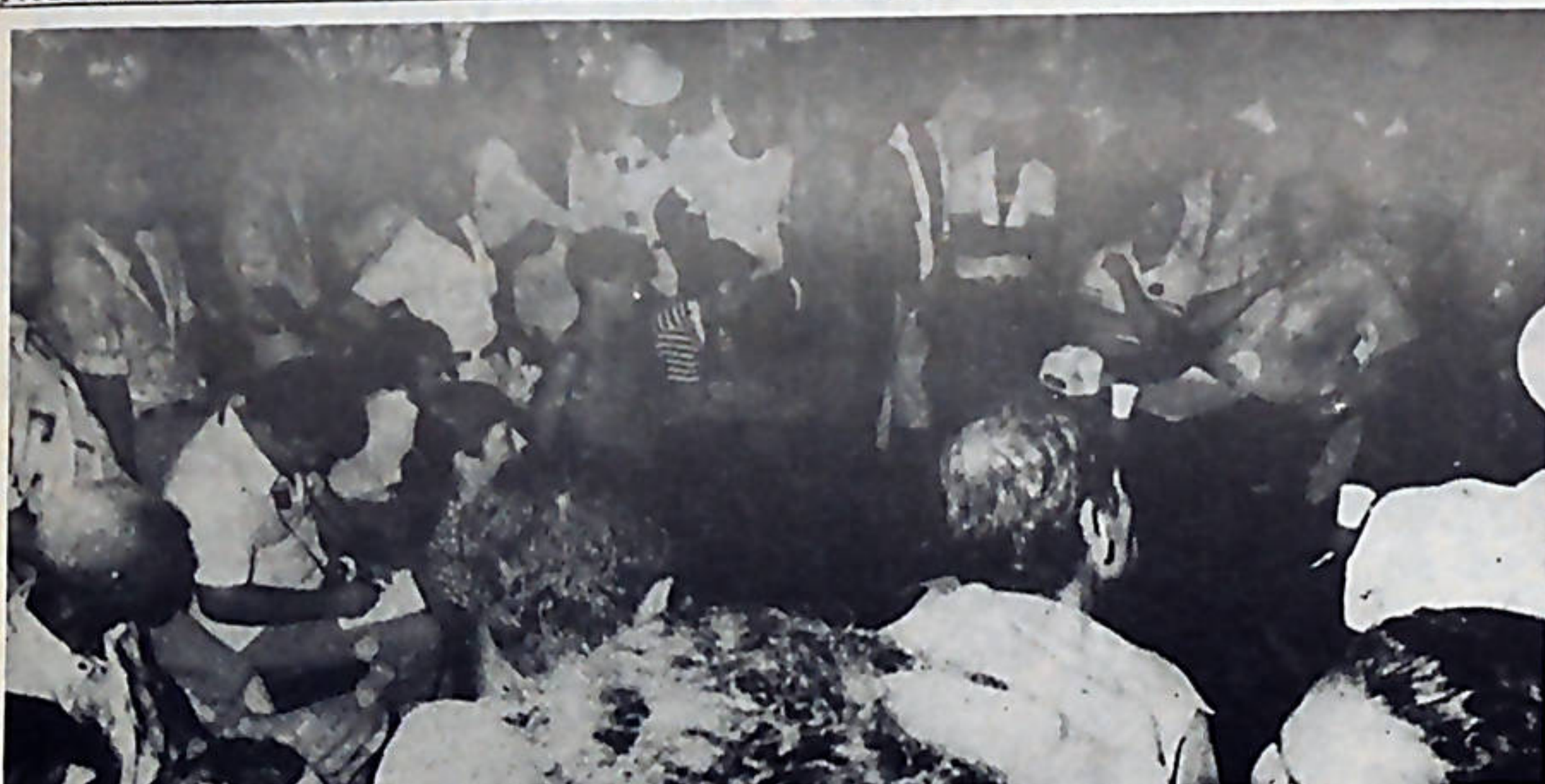
Los maiceros demostraron su firmeza y decisión a los enviados del gobierno en su Asamblea General.