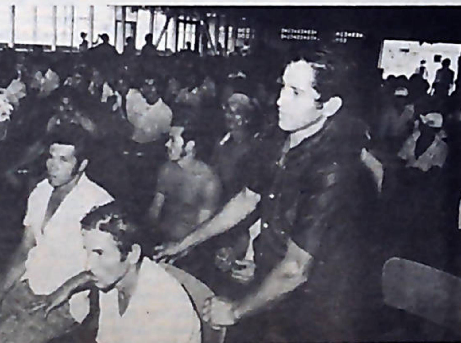
Los pequeños maiceros se reunieron varias veces en Asamblea General para discutir y resolver sobre su lucha.

Los pequeños agricultores de maíz, valoran también como el logro más importante el hecho de que ya cuentan con su propia organización y con una buena experiencia de lucha. El MRP -Partido de los Trabajadores, que estuvo junto a UPAGRA en la reciente lucha, seguirá dando todo su apoyo a los pequeños agricultores, que, desde ya se preparan para emprender nuevas luchas, para vigilar que el CNP cumpla lo prometido y para obtener, más unidos y mejor organizados, nuevas y más importantes victorias.