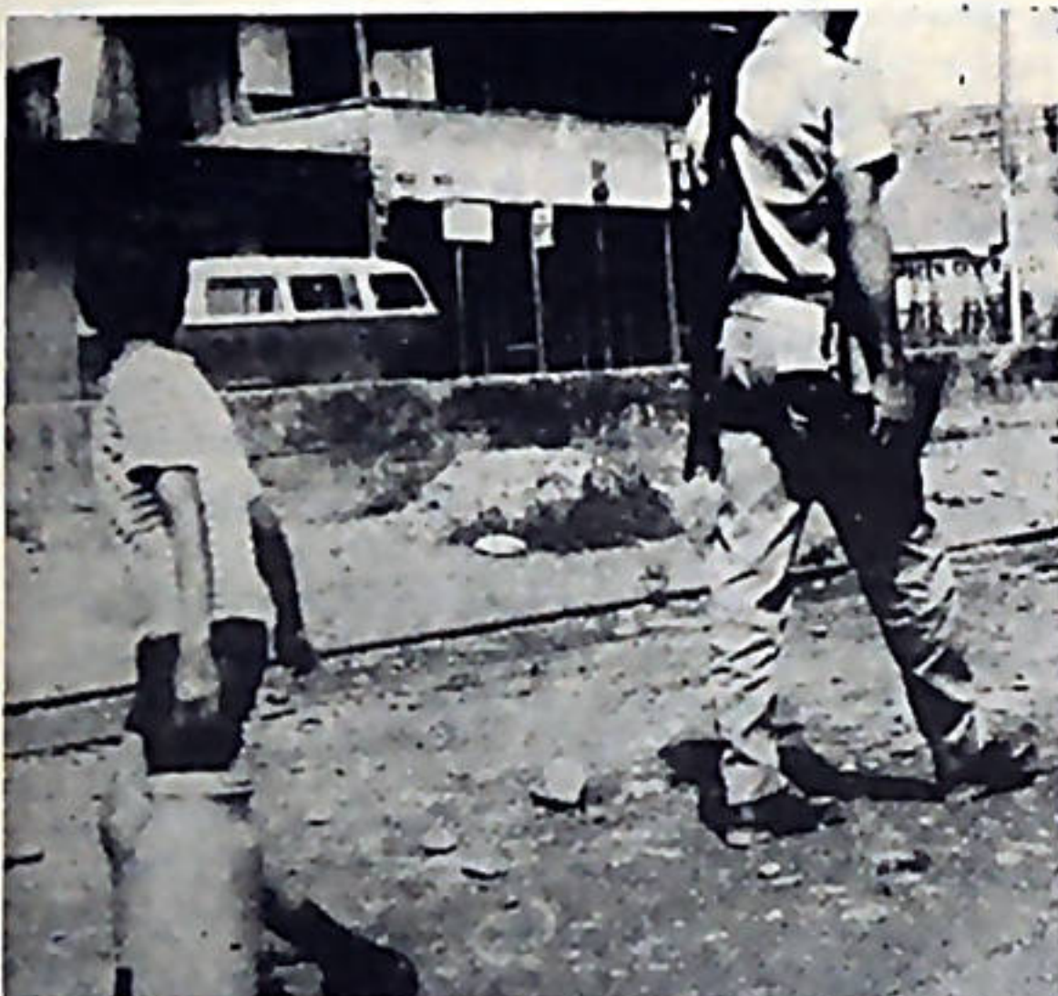
Había tensión en Guácimo. La "Guardia" armada con fusiles, bombas lacrimógenas y batones recorría las calles para imponer miedo.