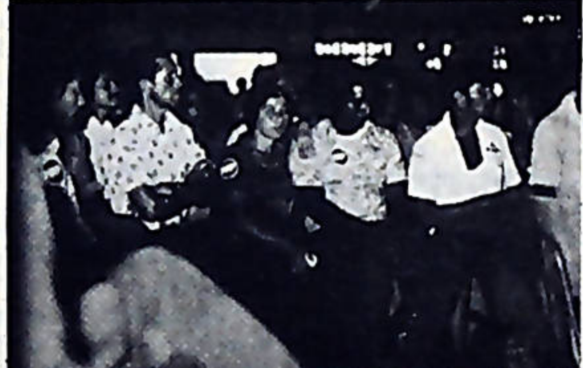
Reunidos en Asamblea General los pequeños maiceros de UPAGRA aprobaron victoriosos los resultados de las negociaciones finales con el CNP.

Este campesino mostró a el fotógrafo de EL TRABAJADOR un moretón que tenía en el pecho, como resultado de la agresión de la Guardia en Carari.