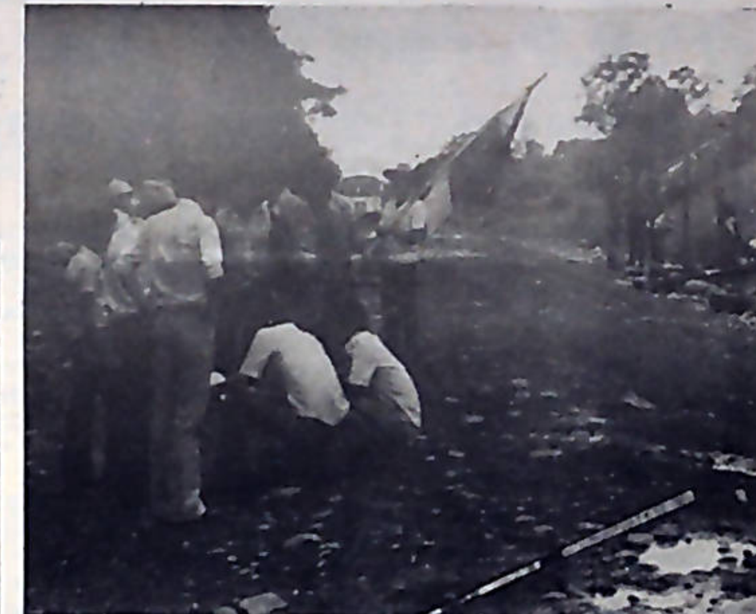
La presencia de la guardia no acobardó a los maiceros, que mantuvieron firme su decisión de no dejar pasar ni un arrión de maíz.