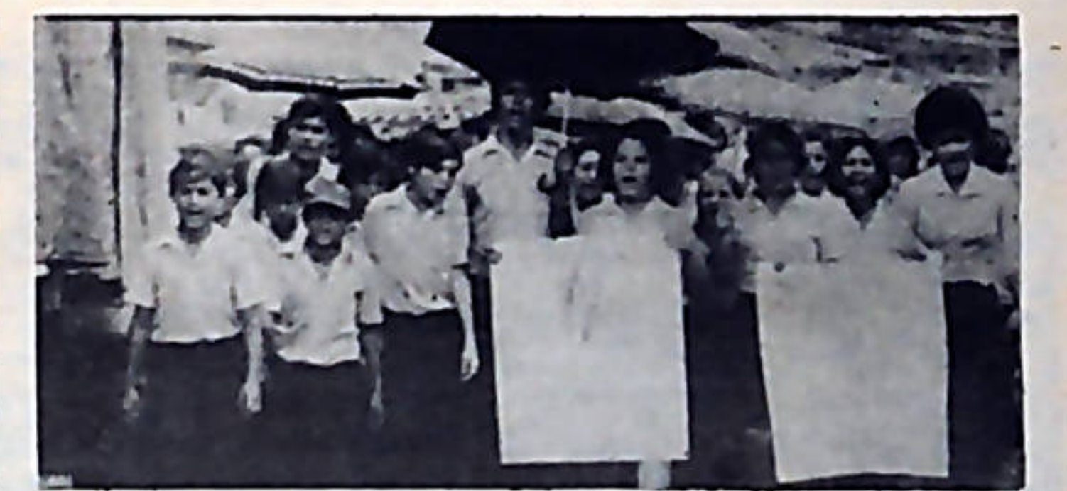
Estudiantes de los liceos de Guápiles y Guácimo se movilizaron para apoyar la lucha de UPAGRA.

Organizados en UPAGRA, y después de diez días de dura lucha, los pequeños agricultores arrancaron importantes logros al CNP. El Consejo Nacional de Producción se comprometió a: —Aceptar la presencia de fiscales de UPAGRA en la romana y laboratorio de los recibidores de maíz. —Crear dos nuevos centros de recibo del grano, uno en Carari y otro en Santa Rosa. —Poner romanas de dos caras. —Brindar asistencia técnica, trabajos demostrativos, días