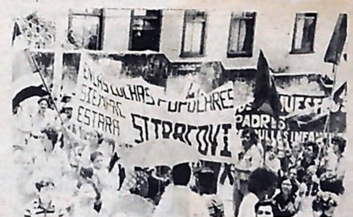
La presencia organizada y combativa de los trabajadores cañeros de SITRACOVI con sus mujeres y sus hijos impresionó mucho el 1o. de Mayo.

Se destacó la participación de la columna del Movimiento Revolucionario del Pueblo (MRP). En ella, obreros cañeros de Grecia y Cañas, pescadores de Puntarenas, campesinos de Guácimo, estudiantes, empleados y dirigentes del partido desfilaron organizadamente, agitando la bandera de Costa Rica y la verde-roja del MRP.