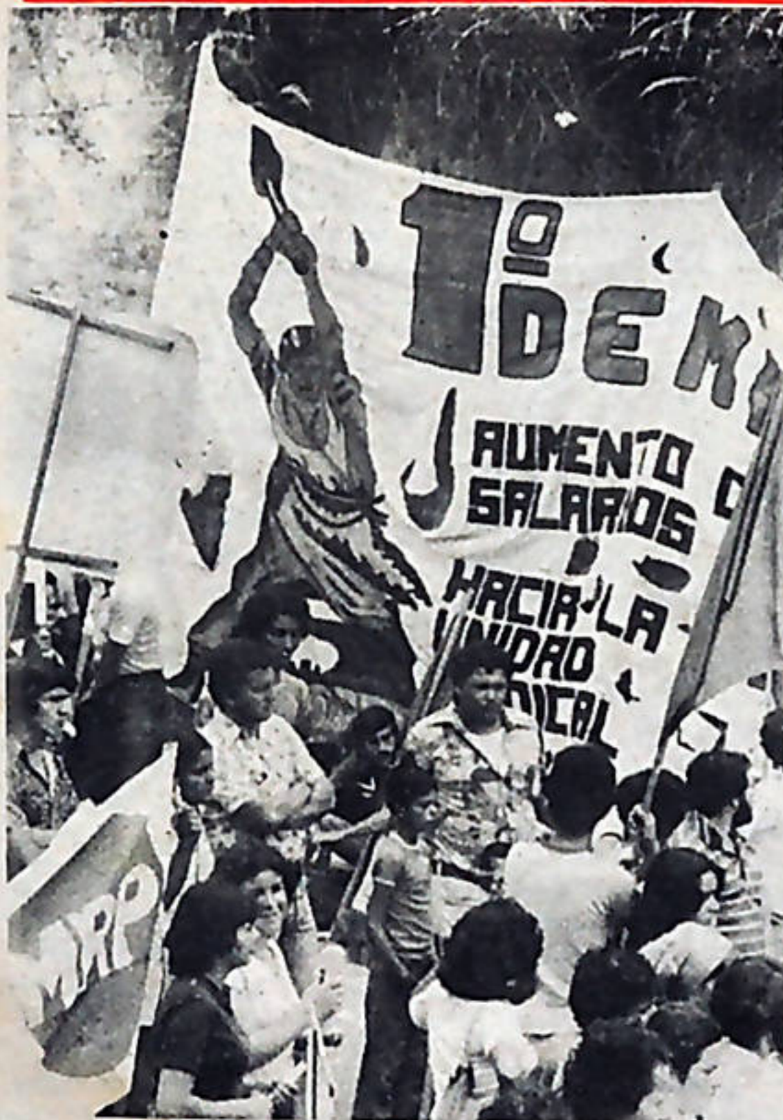
Aumento de salarios y unidad sindical exigieron los trabajadores en el combativo desfile de San José.