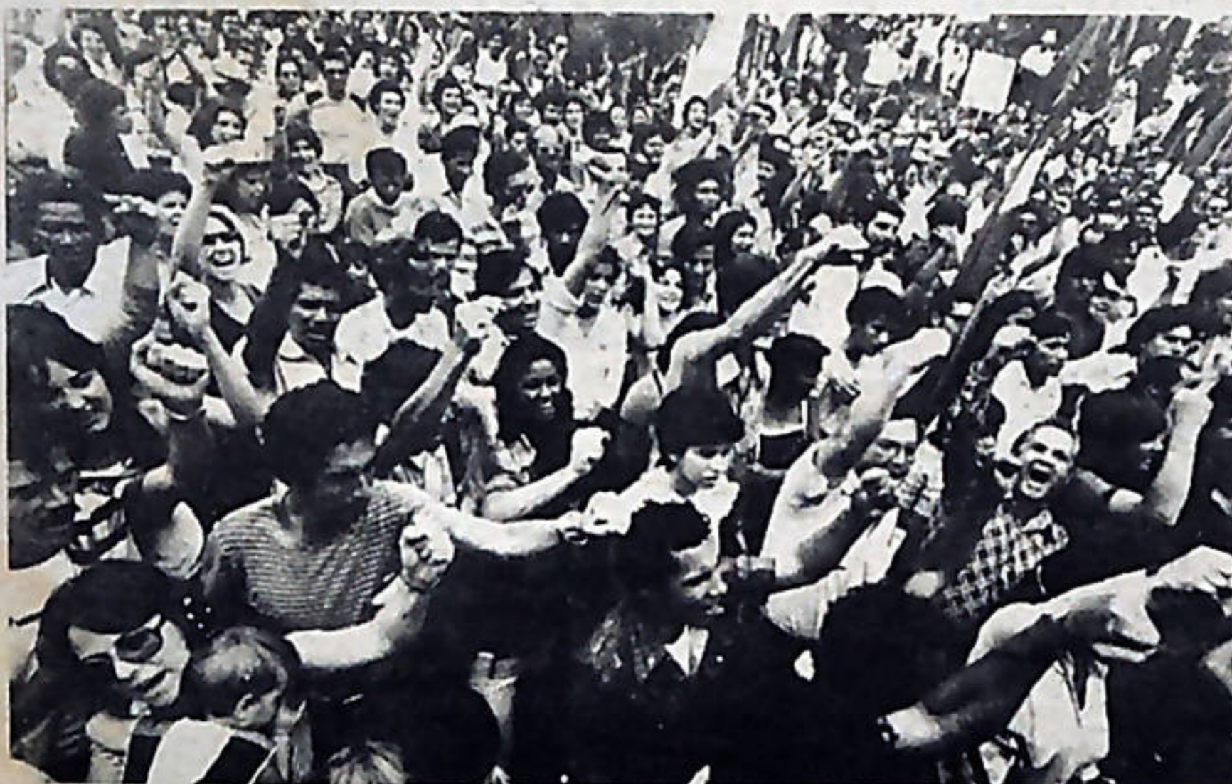
Unidad y combatividad en la concentración del 1o. de Mayo frente a la Asamblea Legislativa.

Más de ocho mil personas desfilaron el pasado Primero de Mayo desde el Hospital de Niños hasta la Asamblea Legislativa, para conmemorar el día internacional del Trabajo.