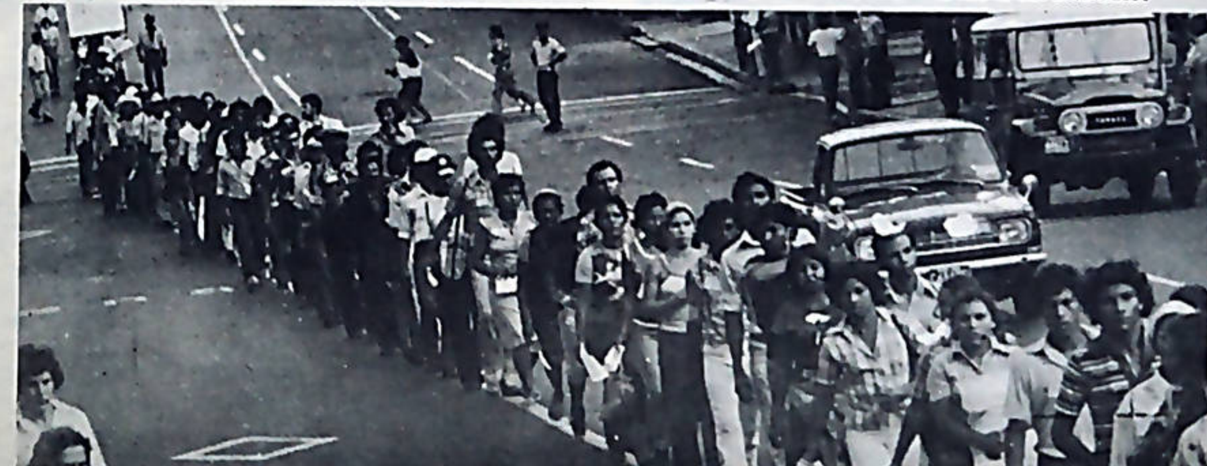
¡No hay huelga!, decían la Empresa y el Gobierno, y los tres dabanri los cañeros las mujeres los ancianos y los niños demostraron lo contrario.