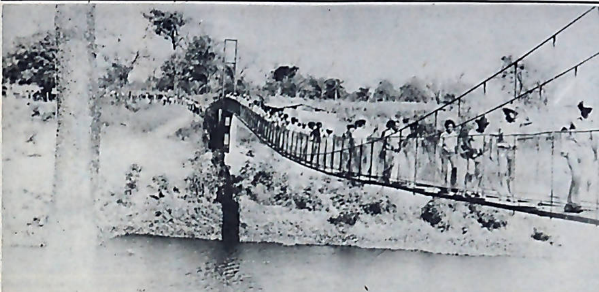
Los trabajadores, al igual que en San José, en forma ordenada y en fila india atraviesan el puente colgante del Río Tempisque, en esta oportunidad se dirigían a CATSA a cobrar su sueldo.