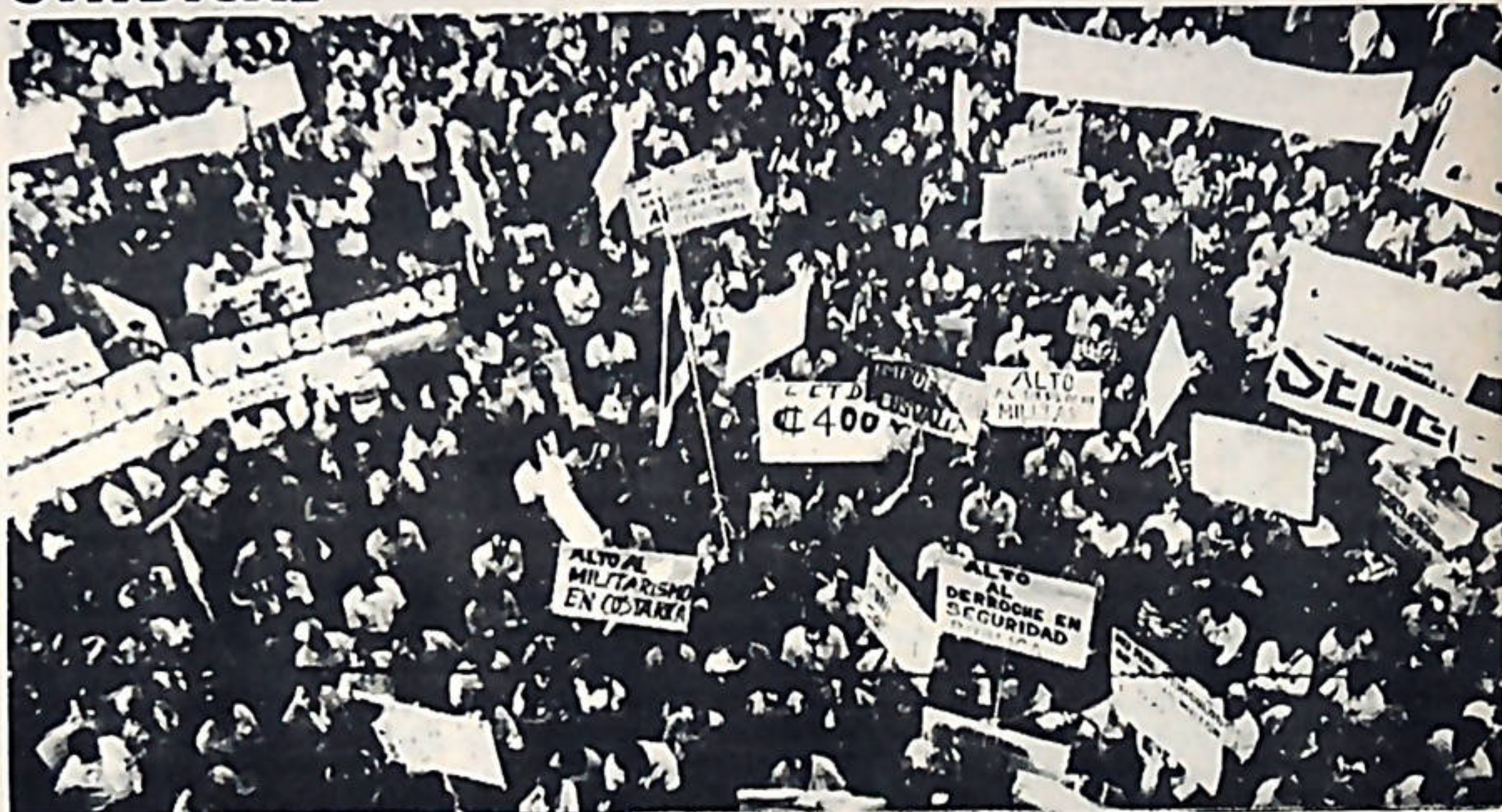
El pasado 29 de marzo los Empleados Públicos en una numerosa manifestación se concentraron frente a radio Monumental para exigir al gobierno mejoras salariales.