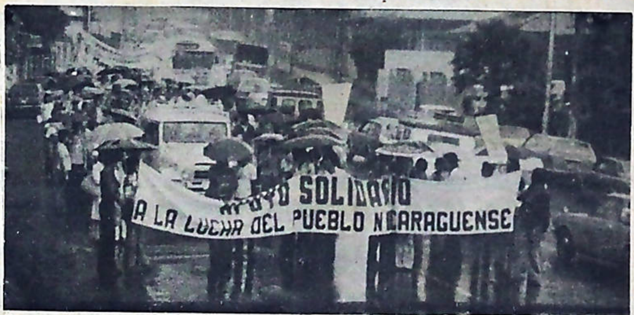
El pueblo costarricense aumenta día a día su apoyo a la lucha del pueblo nicaragüense.