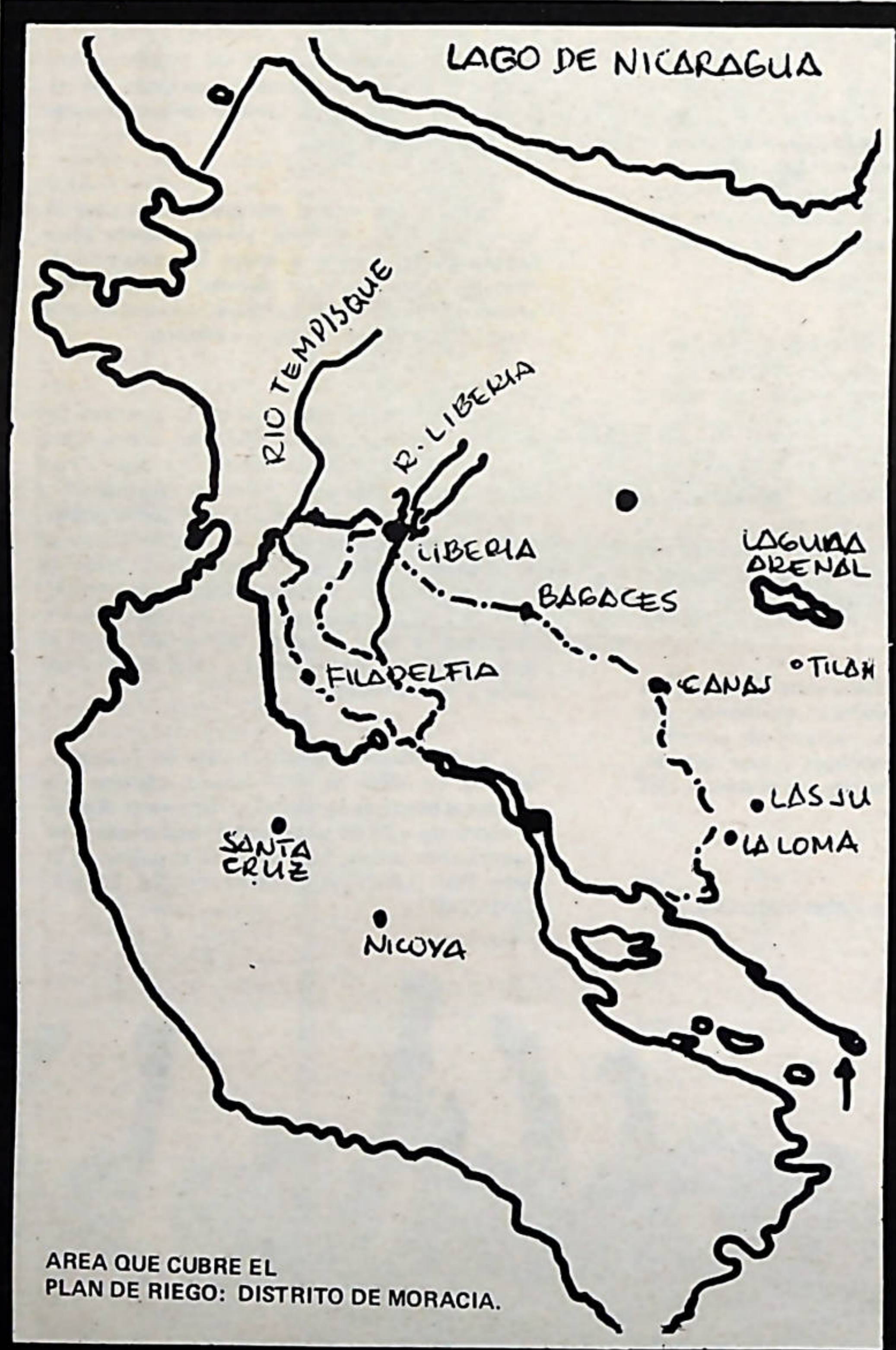
AREA QUE CUBRE EL PLAN DE RIEGO: DISTRITO DE MORACIA.

La masa campesina del país sabe que sus intereses no sólo no están representados por Oduber y sus remendones, sino que lo más seguro es que sus luchas encuentren de frente, además de los grandes terratenientes y acaparadores, a las autoridades dependientes de ese gobierno, que en definitiva es un instrumento más al servicio de los explotadores del país.