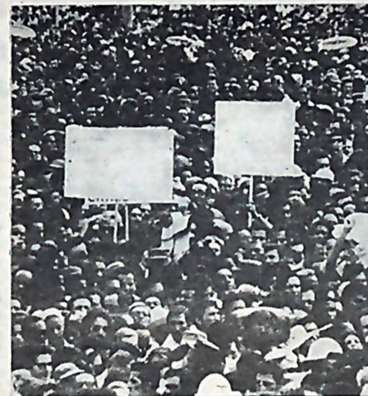
Las luchas de las masas populares latinoamericanas se han multiplicado en los últimos meses.

Los últimos días de febrero y todo el mes de marzo se caracterizaron por un aumento continuado de las acciones reivindicativas en la mayoría de los países de América Latina. Al acercamiento y a la apertura del diálogo entre diferentes fuerzas sindicales, hasta alcanzar en algunos casos, formas unitarias orgánicas. Entre los ejemplos más ilustrativos ha-