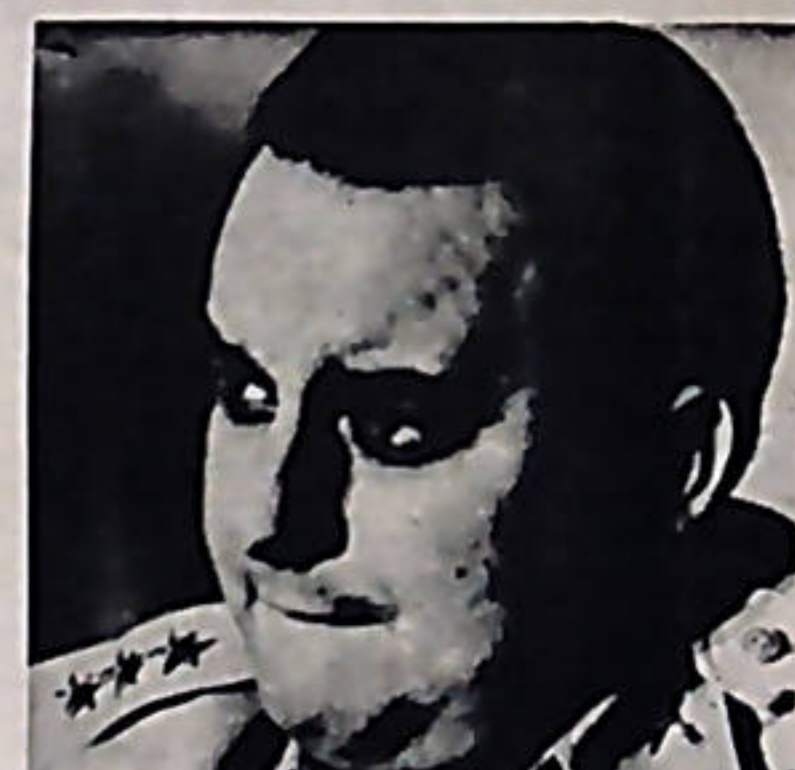
"Tachito" Somoza el verdugo del pueblo nicaraguense. América Latina con una mirada de resignación?

¿Seguiremos creyendo que los imperialistas renunciarán a sus intereses en