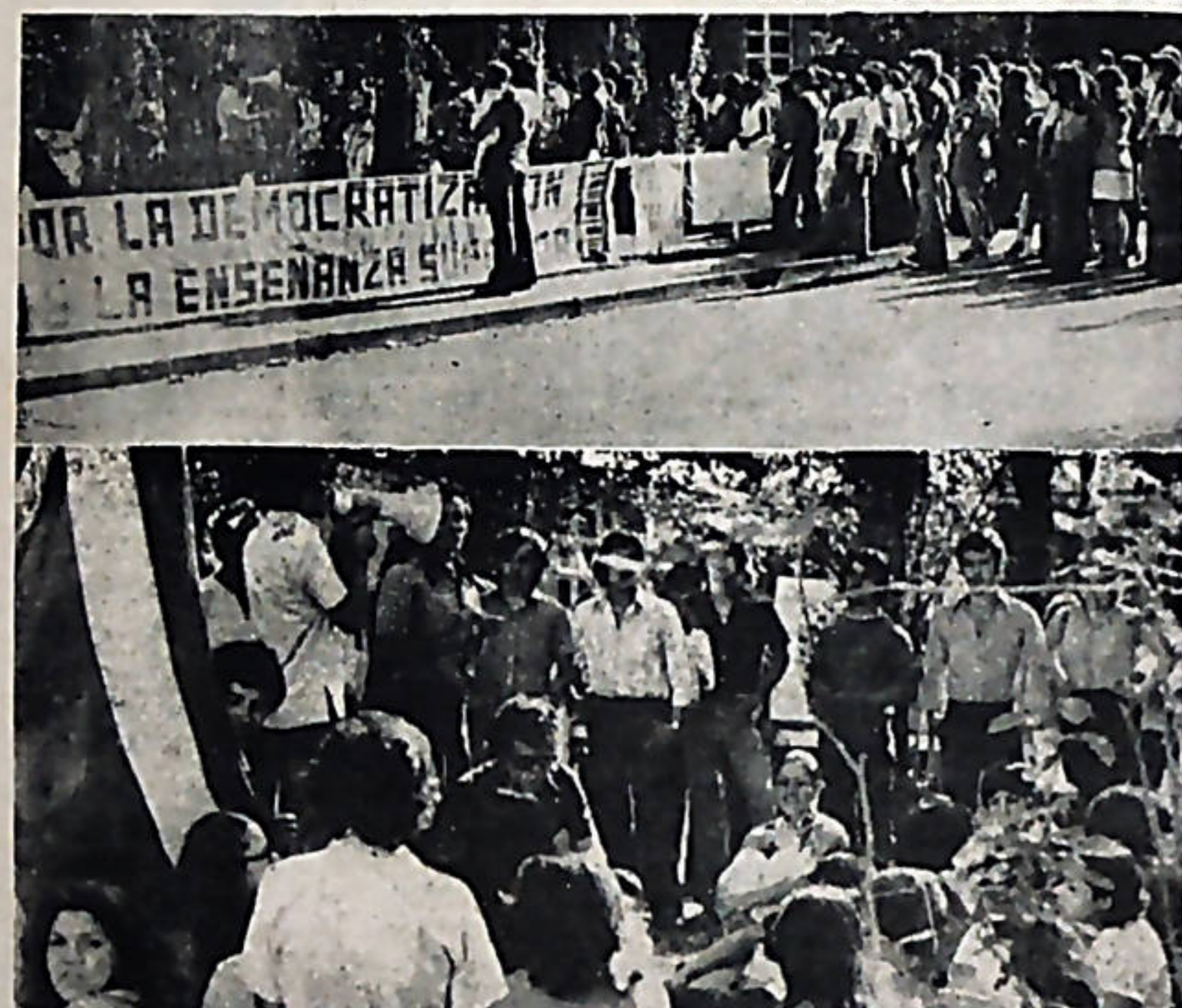
La organización y participación estudiantil es la garantía para la democratización de la enseñanza superior.