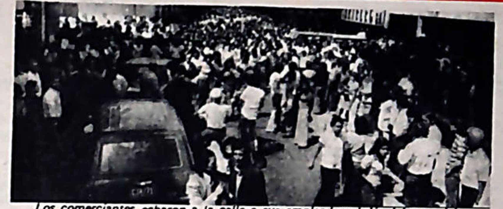
Los comerciantes echaron a la calle a sus empleados el día del paro del comercio. El propósito es obvio: trataban de presentar apoyo popular a sus antipopulares intereses.

Ardón: — Sí claro, hay una importantísima lección que debe desprenderse de los sucesos de que hablamos, esa lección tan importante es la que nos dan las Cámaras Patronales y la burguesía conservadora con su actitud violenta y sediciosa. Si esta vez, para lograr sus objetivos y atemperar el carácter reformista de la política del gobierno, carácter y política que no comprometen el sistema de explotación capitalista que