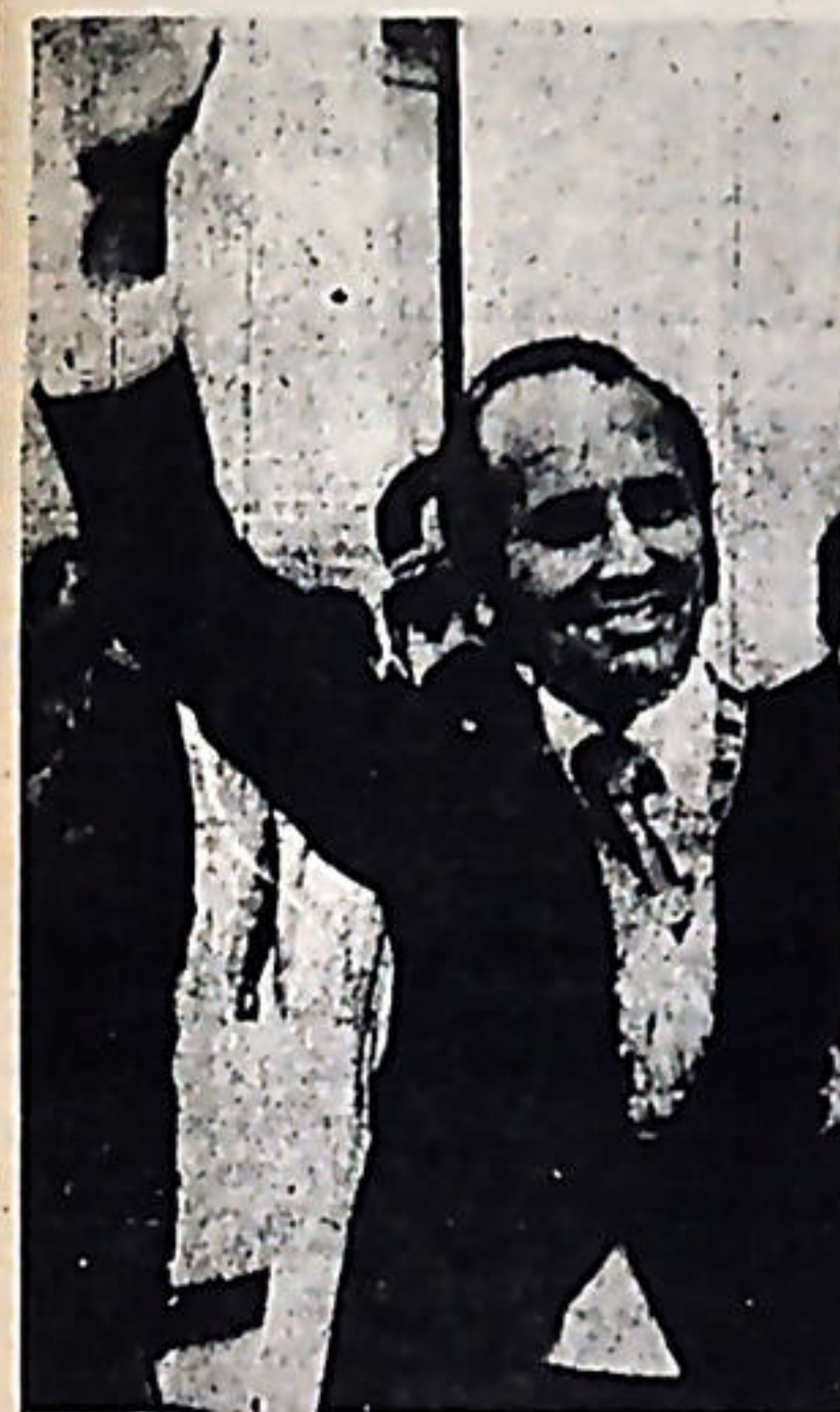
Dr. Carlos Andrés Pérez

zada en la reunión de Puerto Ordaz. Estas declaraciones y los hechos concretos que la acompañaron, han servido a Venezuela para impulsar desde bases más sólidas, su política nacionalista y soberana. Venezuela, hoy un importante frente de la lucha antimperialista en América Latina, necesita ganar aliados, y la forma más segura e inteligente para lograrlo es, sin duda, ayudando a solventar los problemas económicos que la crisis del capitalismo produce en nuestros países. La profunda crisis que hoy vive el mundo capitalista, y que afecta gravemente a los países dependientes, hace resaltar con agudeza las aristas humillantes de la dependencia de éstos y obliga a que hasta sectores de las clases dominantes (aún de los más reaccionarios), reconozcan esa realidad de dependencia como un mal a superar, y evitar con ello, la agravación de los conflictos sociales que se generan en una época de crisis. Conjurar este peligro es asegurar su permanencia como clases dominantes.