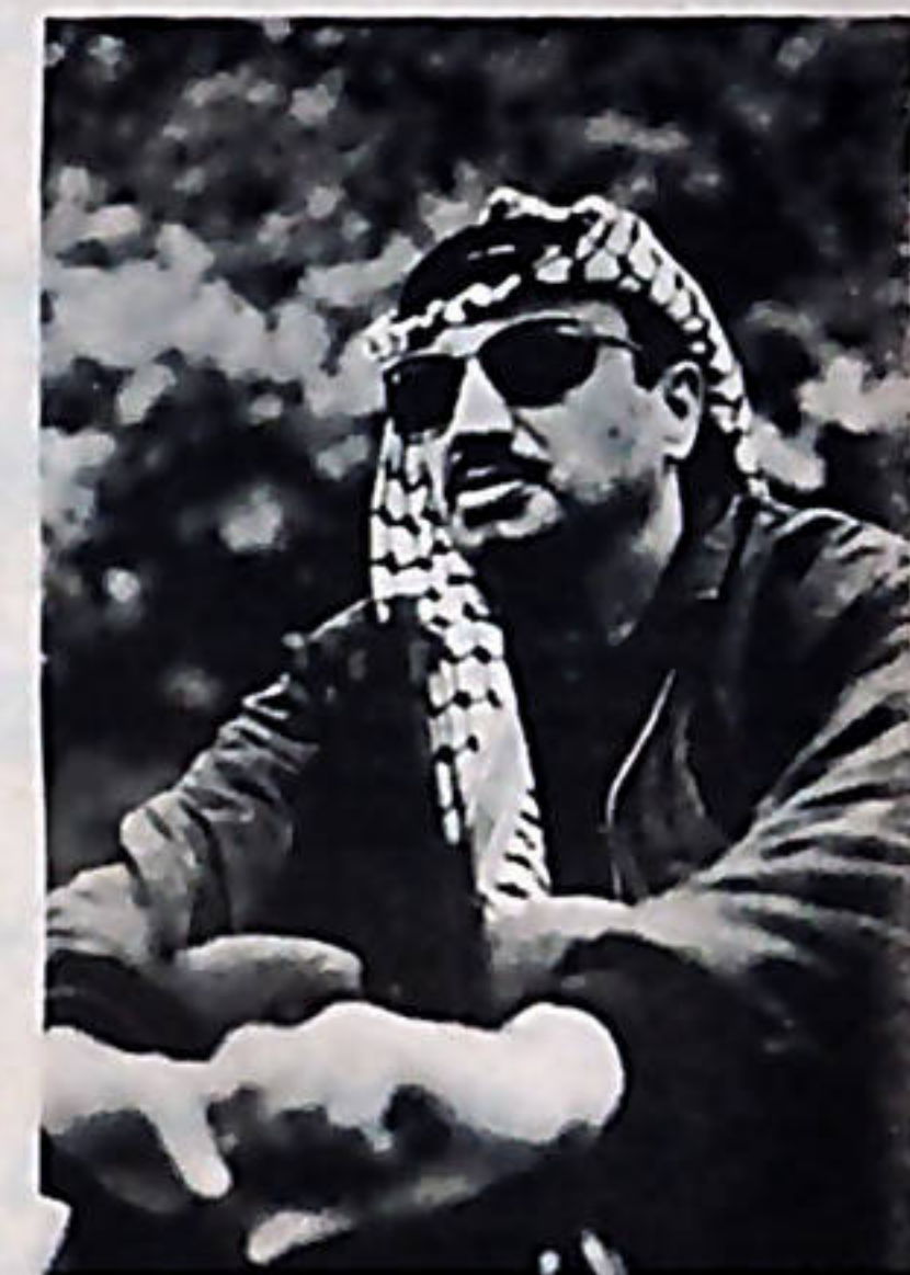
Yasser Arafat: "Tengo en una mano un ramo de olivo y en la otra un fusil, y para mantener ese ramo de olivo necesitamos mantener el fusil."

La Asamblea General de la ONU aprobó en noviembre del año recién pasado, una resolución que reconoce el derecho legítimo e indiscutible del pueblo árabe de Palestina a la independencia, la autodeterminación y la soberanía nacional; igualmente, quedó reconocido el derecho de este pueblo a regresar a su tierra natal hoy en manos del estado sionista de Israel, este reconocimiento jurídico, es un gran triunfo del pueblo palestino y de todas las fuerzas revolucionarias del mundo; es a la vez un fulminante golpe a la política del imperialismo norteamericano en el Medio Oriente, al sionismo. Dos factores muy importantes enmarcan esta victoria.