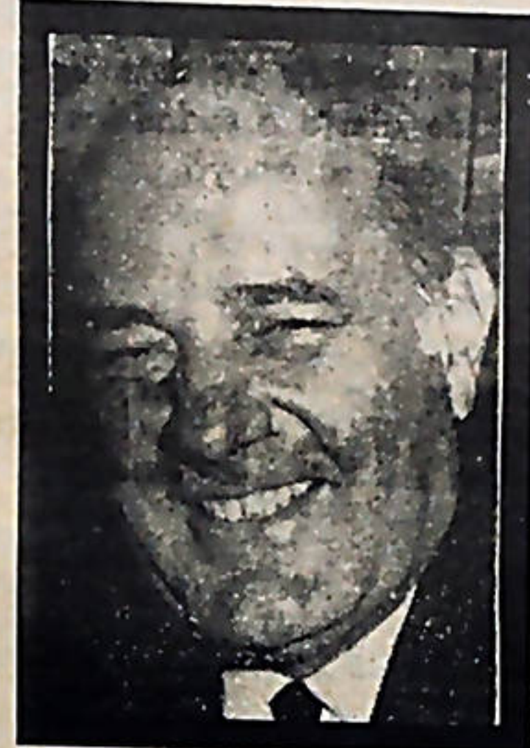
Echandi: Buscando ganarse otra candidatura.