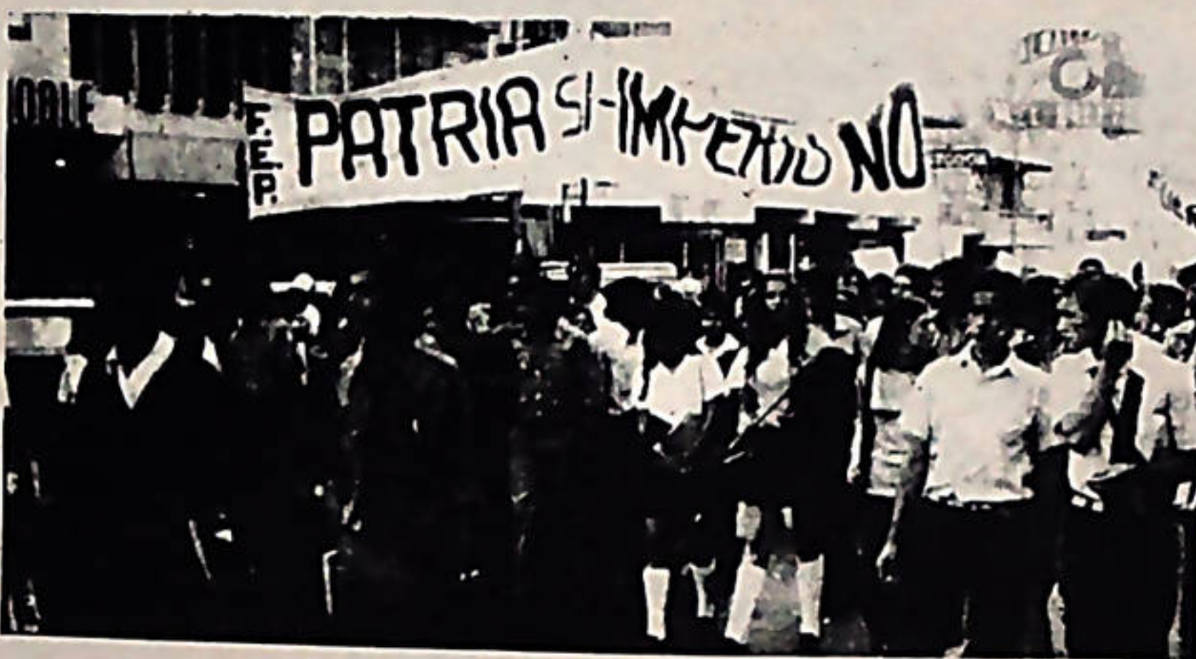
COMPAÑERO ESTUDIANTE: LUCHA ORGANIZADAMENTE EN EL FRENTE ESTUDIANTIL DEL PUEBLO.

Por la víspera se saca el día, dice una frase popular y la dirección de FAENA cuando se conversaba y se trataba el asunto de la unidad, pusieron en primer lugar mezquinos intereses de secta y se negó a participar unitariamente, y las argumentaciones que se dieron ahí y aún siguen dando no explican de ningún modo su conducta política. En esta campaña FAENA confunde en la práctica al enemigo que los estudiantes progresistas y revolucionarios debemos enfrentar. Denuncia por un lado la corrupción del grupo TRABAJO y por otro, con mayor énfasis y ensañamiento al "fanatismo" e "infantilismo izquierdista".