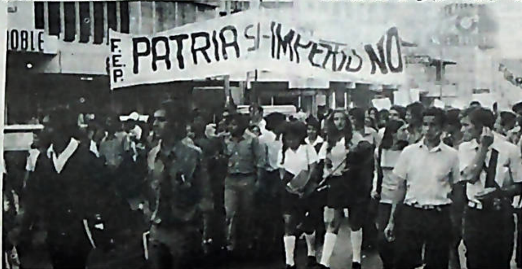
Las luchas estudiantiles son la respuesta a la actitud antipatriótica de quienes nos gobiernan.

Sabemos que una lucha de tal naturaleza, una lucha que marque los primeros pasos del proceso real de reforma, se enfrenta y enfrentará con enemigos internos en el seno de la Universidad, los abanderados de una Universidad como institución independiente y aislada de nuestra realidad.