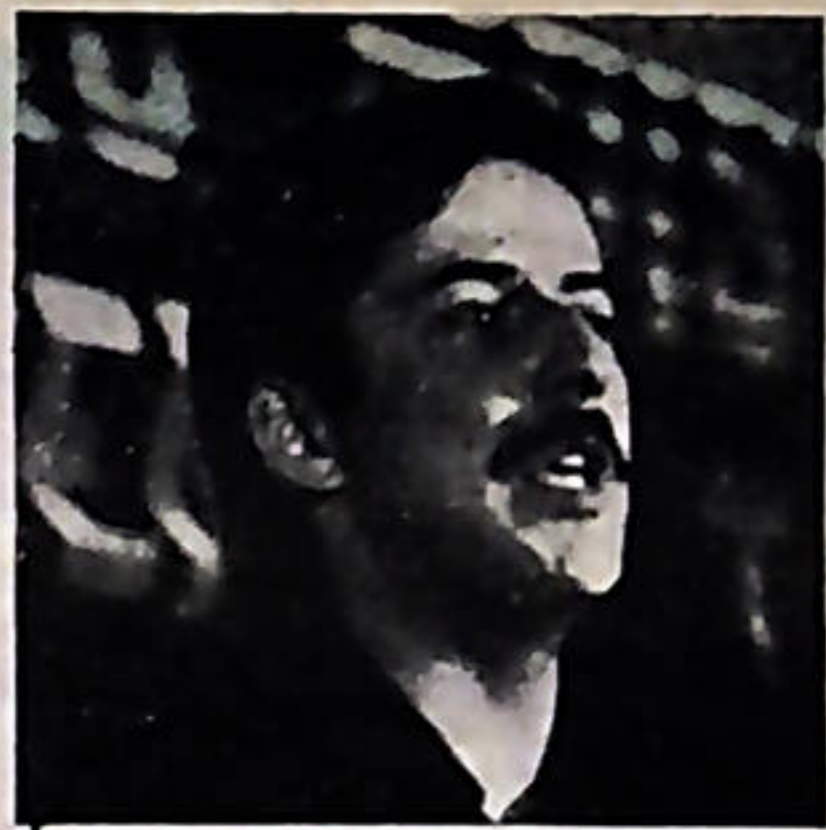
Miguel Enriquez, Secretario General del Movimiento de Izquierda Revolucionaria (MIR).

Las fuerzas revolucionarias y patrióticas de Camboya han virtualmente cerrado el cerco sobre la capital Phnom-Penh y mantienen una constante presión sobre las posiciones del régimen derechista que tiene sus días contados. Camboya, como Viet-Nam y Laos han demostrado con claridad la fuerza invencible de los pueblos, cuando guiados revolucionariamente enfrentan a sus enemigos con la razón de la fuerza y la fuerza de la razón.