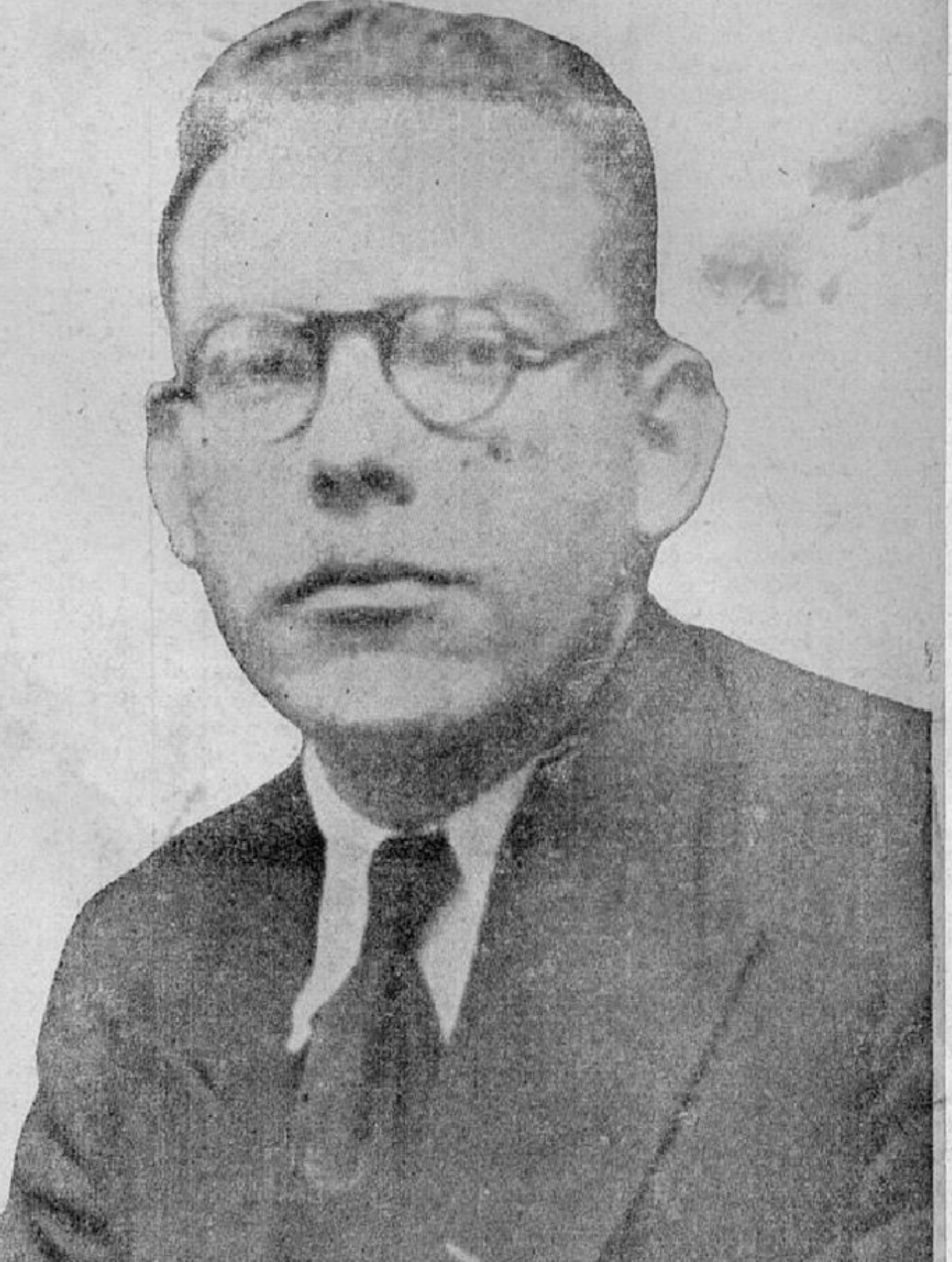
LICENCIADO DON MANUEL MORA VALVERDE

Manuel Mora Valverde hablará mañana domingo en la plaza España. Su voz será la voz del pueblo de Costa Rica. Todos los trabajadores se sentirán ese día representados por su dirigente más genuino y destacado. La esperanza del pueblo por un futuro mejor, encuentra en él su mejor adalid.