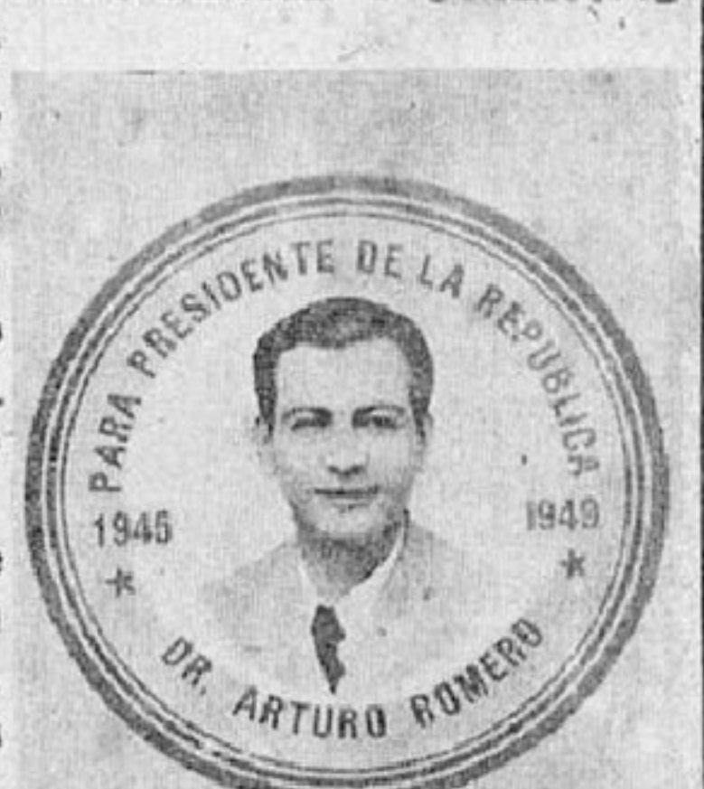
Herero de la Revolución del 2 de Abril de 1944.

Inmediatamente después de la caída de Martínez, los dirigentes democráticos de El Salvador supieron darse cuenta de la necesidad de organizar al pueblo para tener así verdaderos instrumentos de