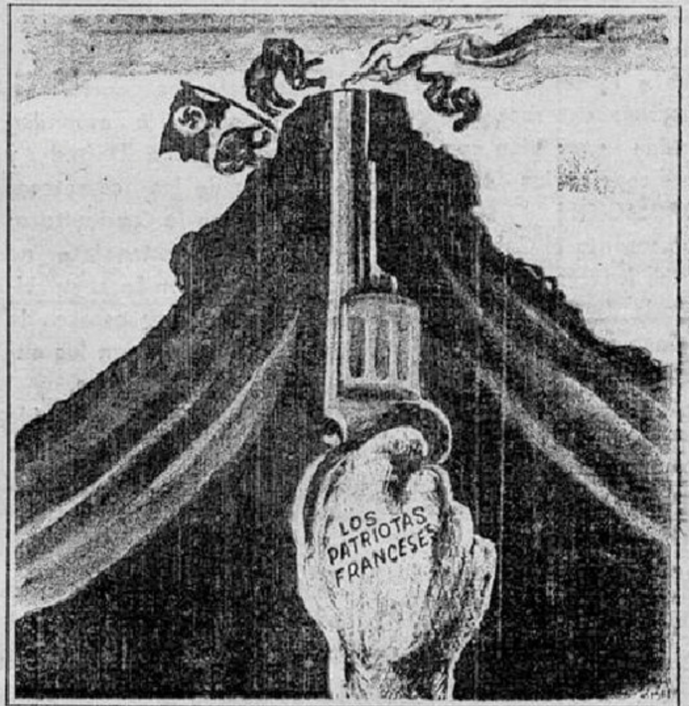
Bishop en el St. Louis Star-Times.