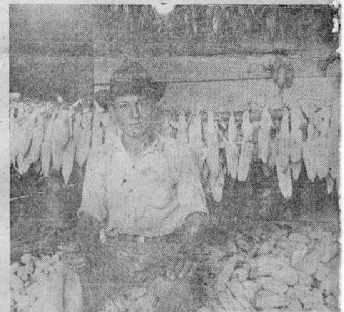
Un colono de "Cimarrón", que antes era un peón mal pagado sin esperanza y sin porvenir, ahora es un propietario pleno de fuerza, optimista, alegre y dispuesto a duplicar la extensión de su milpa. Aquí lo vemos rodeado del producto de su fuerza; miles de mazoreas de maíz.

VIENE de la Pág. UNO — concretos; no son simples mesas. Al doctor Calderón Guardia, que encuentra el respaldo de todos los campesinos de Costa Rica. Estos son hechos familiares costarricenses.