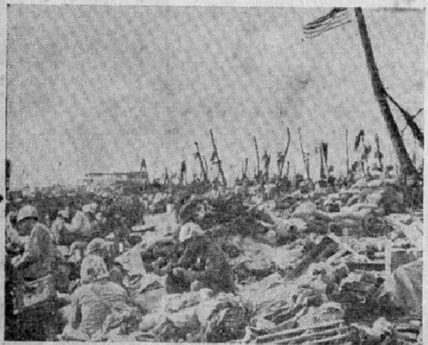
Soldados de la infantería de marina estadounidense descansando después de la batalla para tomar la isla de Roi del grupo de las Marshall (Pacífico Central). El pabellón de los Estados Unidos ondea desde lo alto de una palmera destruida, vestigio del bombardeo que acabó con la guarnición japonesa de dicha isla.