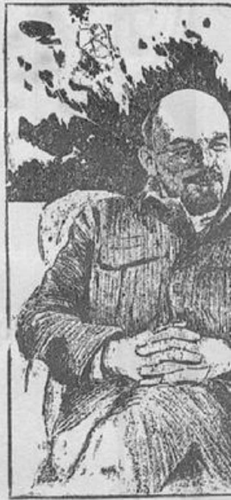
LENIN y STALIN, grandes

No es difícil prever y apreciar el rol que esta juventud manifiesta jugará en la defensa de su patria, en la lucha contra los agresores fascistas. Un acontecimiento profundamente hermoso tal vez el más hermoso que es posible presentar en el mundo, fué el desfile de los jóvenes que practican el deporte y la cultura física, el 24 de julio en Moscú. Un desfile de 30000 jóvenes de las 11 Repúblicas, representantes de millones de jóvenes de toda la Unión Atavia, dos con sus trajes que recordaban el vestido regional típico de cada pueblo, cantando sus propias canciones, desfilaron los ru-