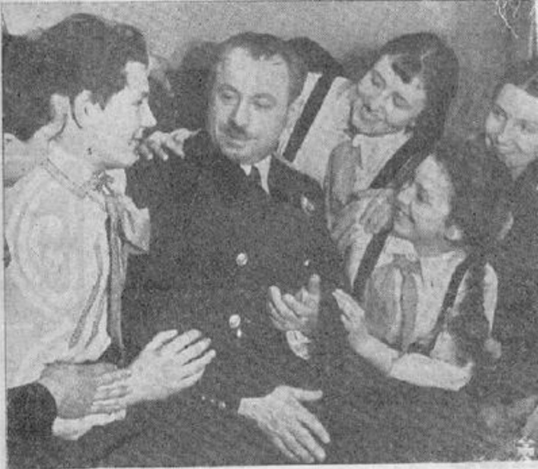
PAPANIN, uno de los héroes del Ártico cuenta sus aventuras en una escuela

En la época zarista la producción de calzado era de unos 7 millones de pares, de los cuales gran parte se quedaba sin vender porque la mayor parte de la población no llevaba zapatos; los campesinos usaban un calzado primitivo hecho de corteza de árbol. En 1937 se fabricaron 160 millones de pares que no alcanzaron para el consumo. Este detalle habla muy alto de la elevación en el nivel de cultura del pueblo en la Unión Soviética. Es sabido que cuanto más culto es un pueblo, menos gente descalza tiene.