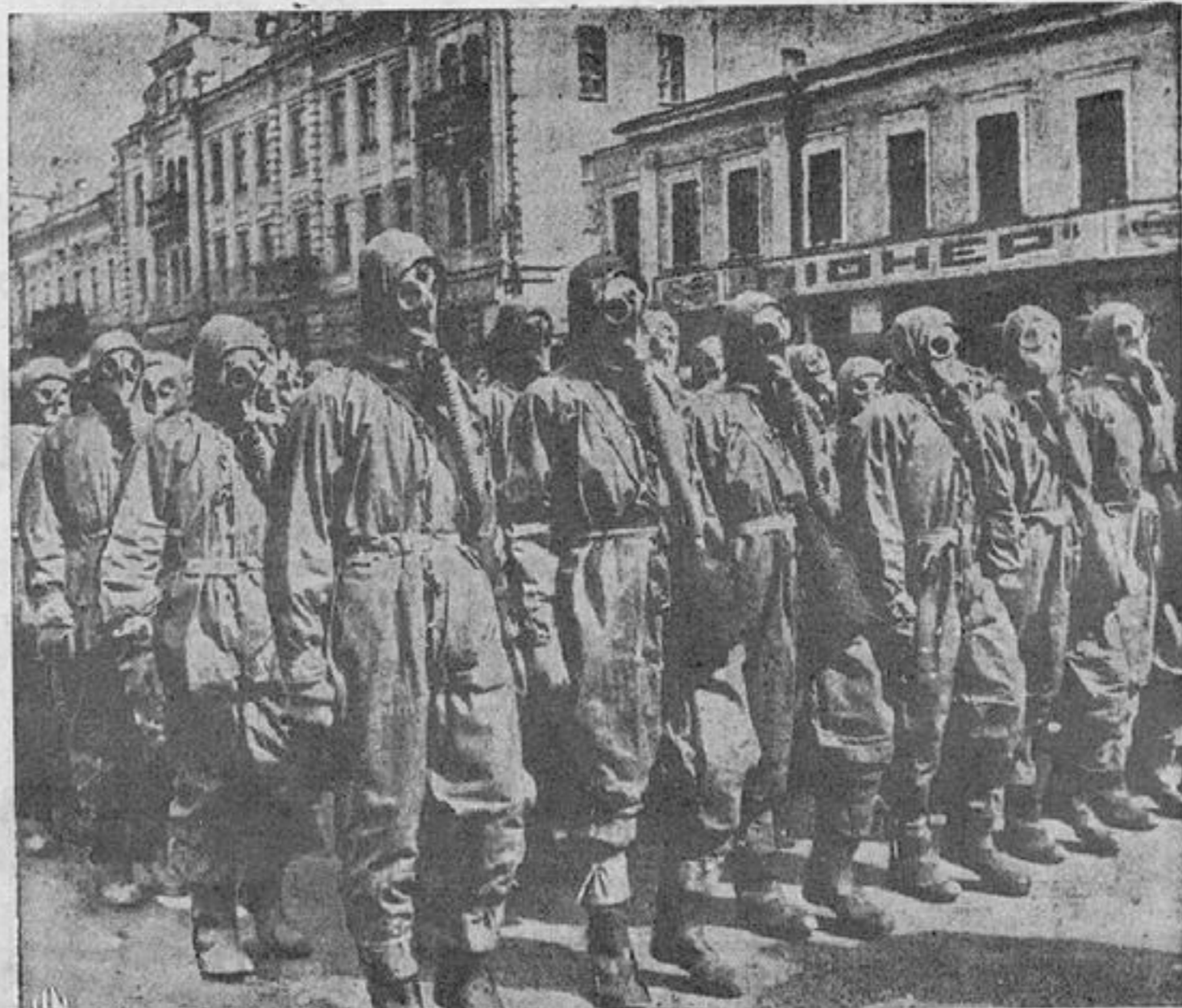
Soldados del EJÉRCITO ROJO, equipados con sus máscaras contra los gases

nista. Un ejemplo elocuente de la unidad del pueblo lo encontramos en las elecciones últimas, de diputados a los Consejos Supremos de los Soviets. De acuerdo con la Constitución Staliniana, existe ahora en la URSS el sufragio universal, igual, directo y secreto. Todo el mundo puede votar y ser votado. Y a pesar de que en esta votación han podido participar inclusive los antiguos kulaks, oficiales del ejército