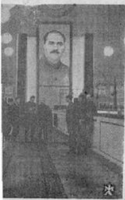
Exposición industrial en Moscú