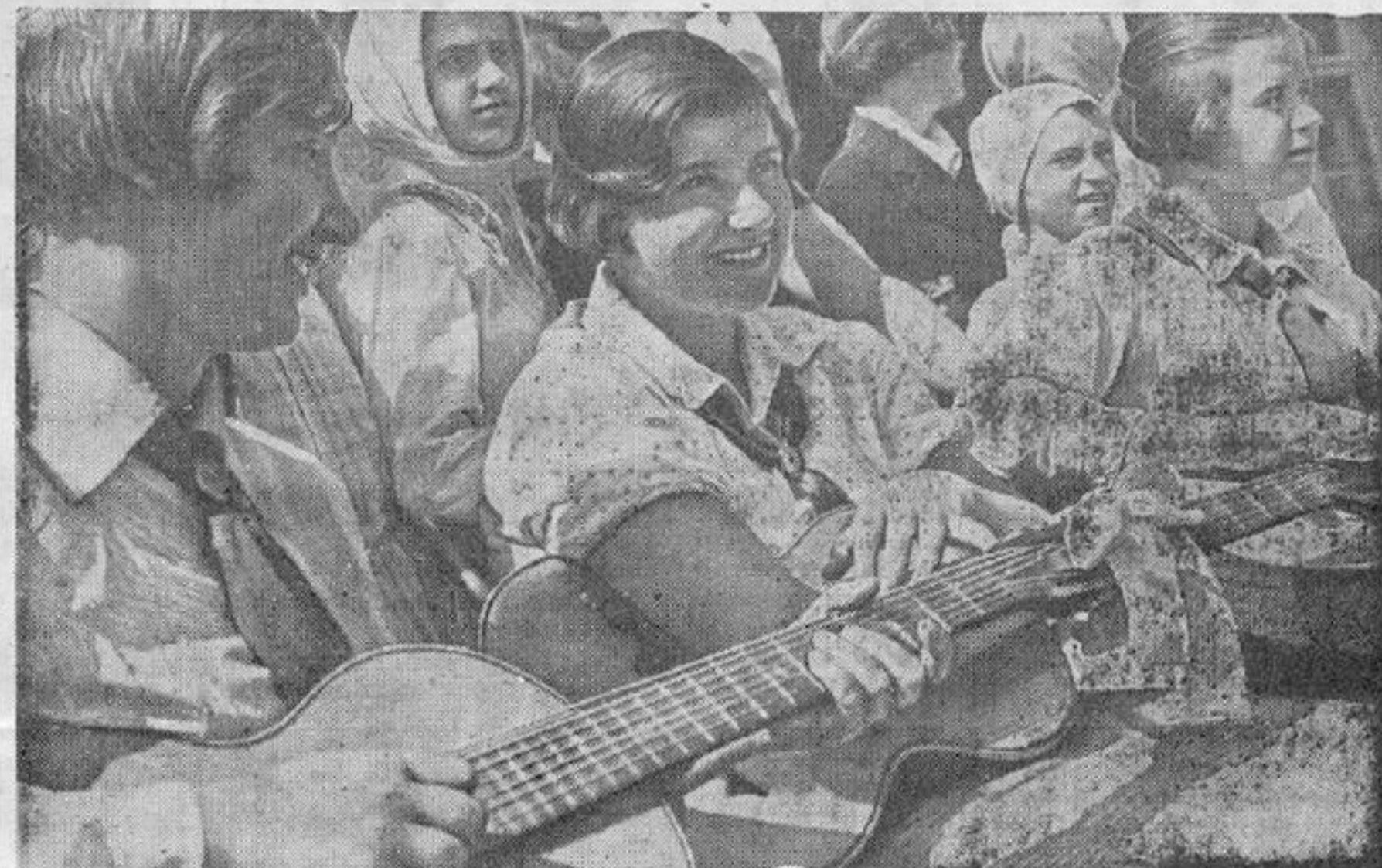
Aquí se ve un grupo de jóvenes músicos en un koljós

No importa que los Regenerados trotskistas bujarinistas, unidos al fascismo internacional, hayan querido cubrir el país socialista con la san-