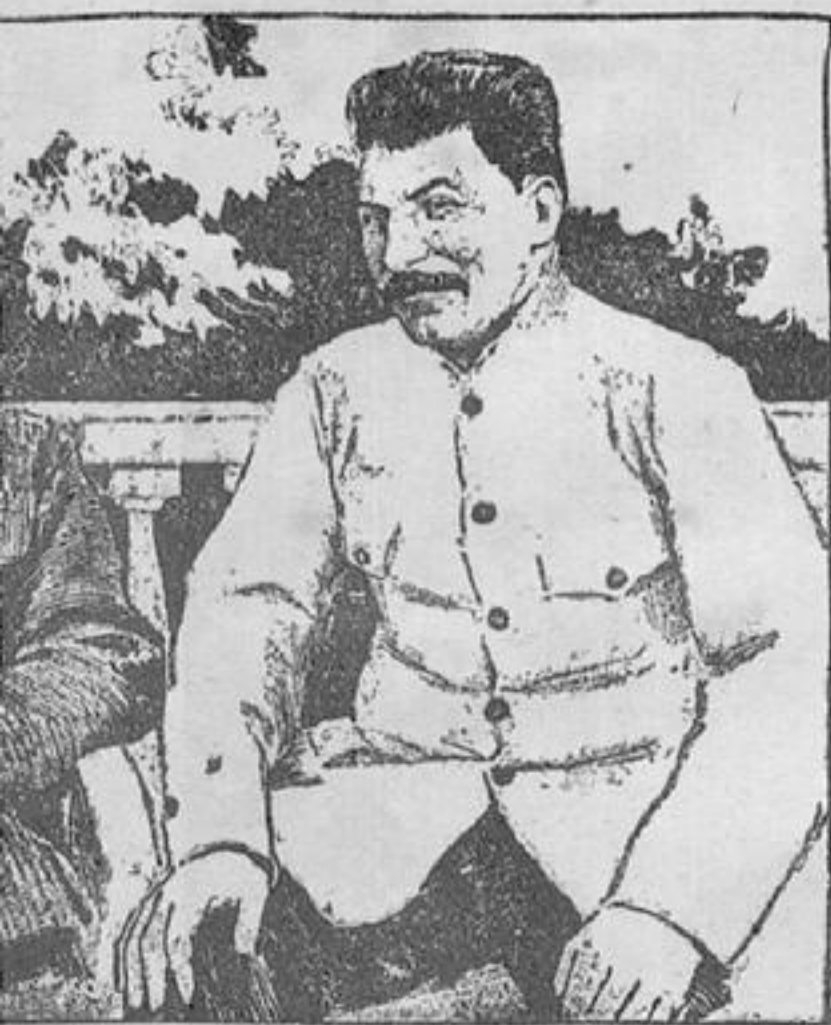
...os, conversando en el jardín de la casa del primero