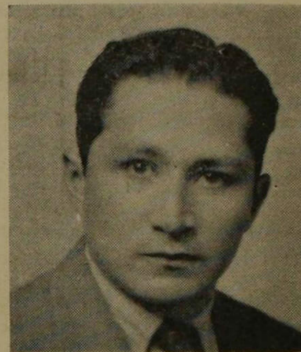
Alberto Carrasco Hermoza (1941)

cepto social del arte es el único que está en lo cierto cuando se trata de las influencias de la vida colectiva en la obra y en el artista, y de los efectos sociales que éstos producen" (1).